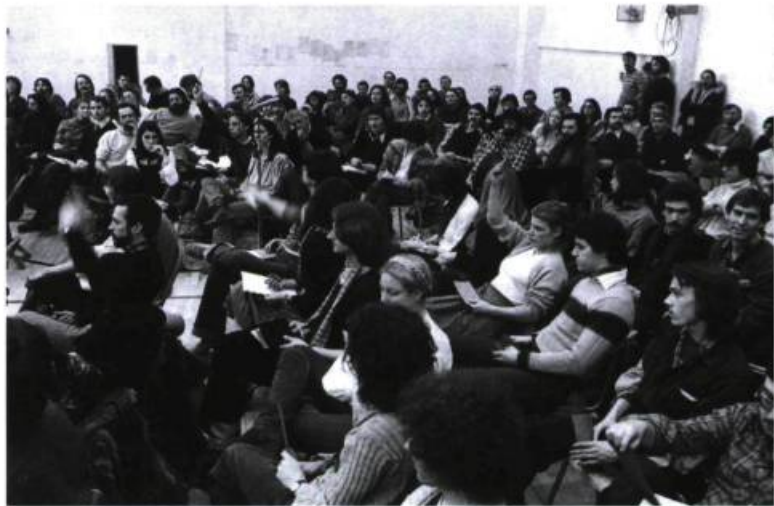
Assemblée à l'Atelier Continu le 13 septembre 1979, de laquelle est issu le comité organisateur des premiers États généraux en 1981.

Puis, le 6 novembre 1981, à moins d'une heure de l'inauguration des assises des États généraux, le secrétaire de l'ADT faisait lecture au comité organisateur d'une résolution adoptée l'après-midi même par les membres de l'Association, selon laquelle « l'ADT ne participe pas aux délibérations des États généraux; réserve son opinion sur les suites et les recommandations des États généraux et demande à son secrétaire général de ne pas participer aux délibérations des États généraux ». Divers motifs sont invoqués :