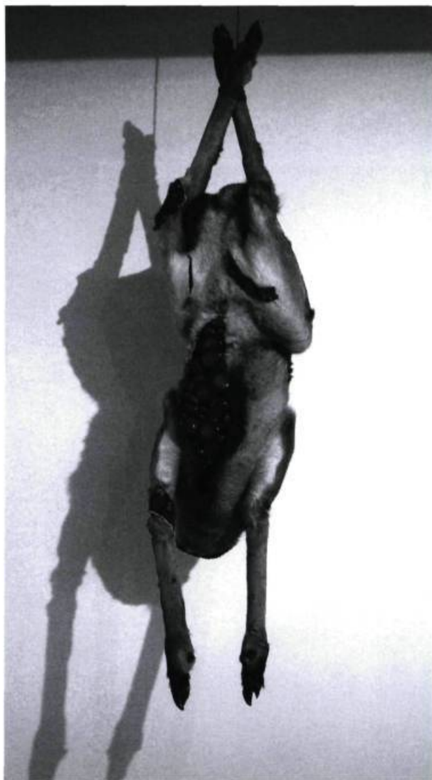
Angela Singer, W Button , 2007. Vieux cerf empaillé recyclé et matériaux divers. © < www.angelasinger.com >, avec l'aimable autorisation de l'artiste.

Dans le second cas, en confrontant le public à des animaux mis en scène d'une certaine manière, le plus souvent des animaux morts, l'art joue un rôle de révélateur. Il brise l'hypocrisie ambiante, dévoile et révèle cette souffrance animale que les consommateurs et les industries mettent tant d'énergie à dissimuler. Le simple fait de présenter les animaux en trois dimensions, plutôt qu'en deux à l'écran, rend la confrontation plus forte et diminue la mise à distance, permettant ainsi au souci éthique de se développer. Le fait d'utiliser des animaux morts, qui n'ont plus d' anima , qui sont donc des objets, suscite la réflexion puisque les vivants sont précisément utilisés comme des objets. La démarche en tant que telle peut être comprise comme une dénonciation. Donnons plusieurs exemples.