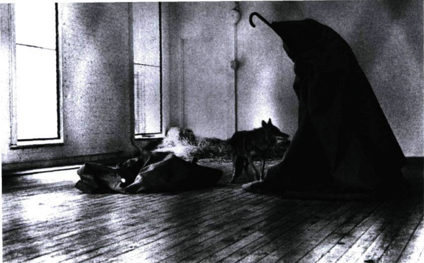
Joseph Beuys, I Like America and America Likes Me , mai 1974. Vidéo, action d'une semaine avec un coyote à la galerie René Block, à New York.

met en scène une éléphant indienne qui simule sa propre mort – l'année même où des militants se mobilisent contre la maltraitance d'une autre éléphant, Samba, violente pour avoir refusé d'exécuter ce même numéro pour le moins curieux.