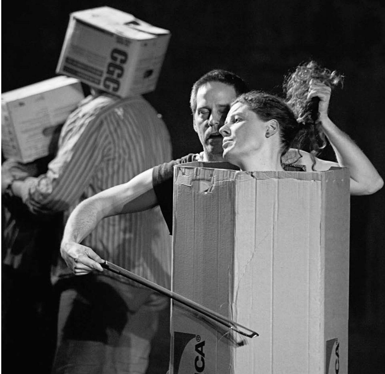
Ronfard nu devant son miroir (NTE, 2011).