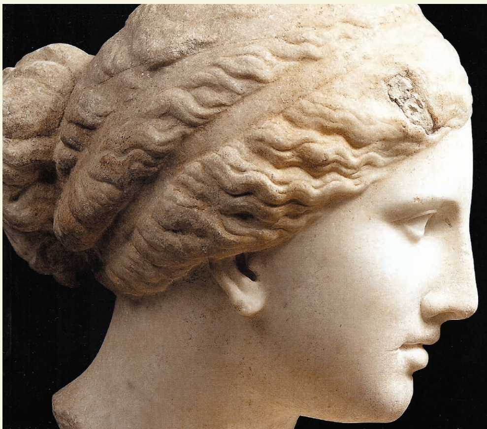
Une jeune fille... Tête féminine du type de «L'Aphrodite de Cnide», dite Tête Kaufmann , v. 150 av. J.-C. Musée du Louvre.

LA JEUNE FILLE ( en colère ) – J'ai tout entendu. Tout. C'est minable. Minable.