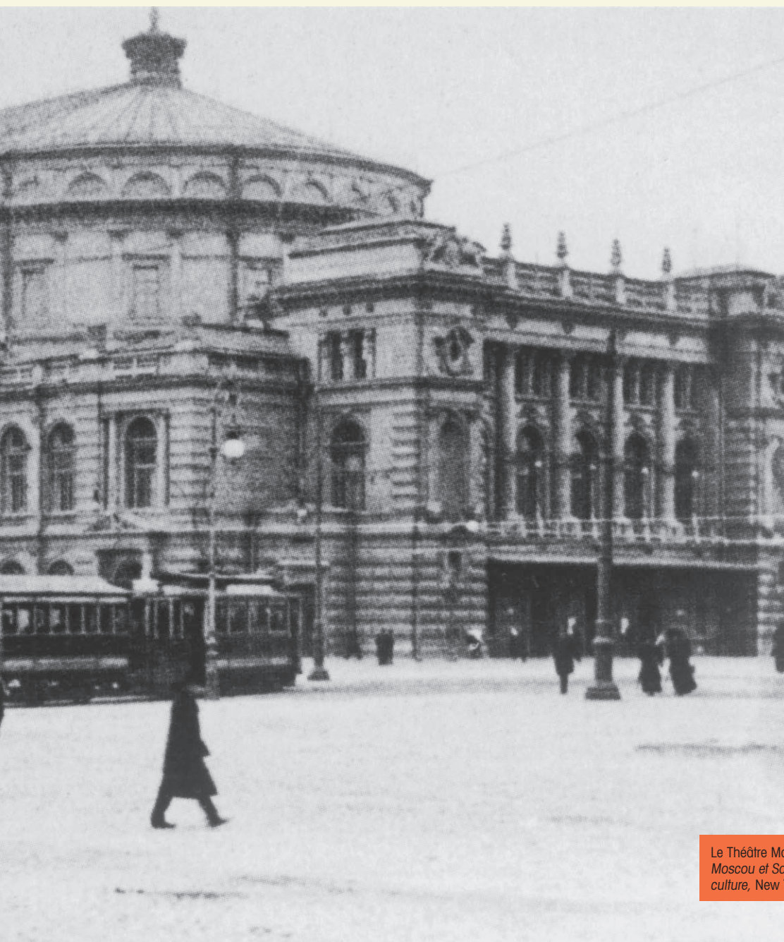
Le Théâtre Mariinsky, Saint-Pétersbourg.

Dernière affaire, j'ai pas une seule bonne idée pour sauver le Gauvreau, j'en ai 10! Là, on fait des raccords avec les finissants; les femmes, on réessaye les costumes, pis on enchaîne, tout le monde, à 13 h 30 tapant. À compter de lundi, on enchaîne pendant les 15 prochains soirs dans la Serge-Denoncourt avec l'équipe de techniciens au grand complet. On va être prêts comme jamais pour la grande première de L'Antichambre velue du diable le 22 décembre prochain. Ça va être le plus beau réveillon théâtral que le Québec aura jamais connu, vous pouvez me croire sur parole.»