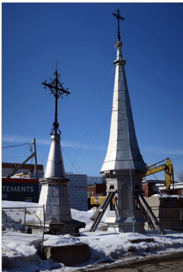
ILL. 6. LE CLOCHER ET LE CLOCHETON DE L'ÉGLISE SAINT-JOSEPH EN FÉVRIER 2017.