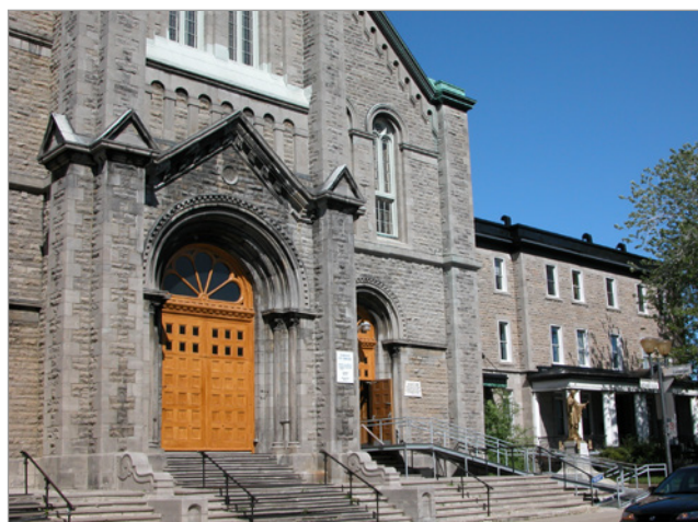
ILL. 5. L'ÉGLISE SAINTE-BRIGIDE-DE-KILDARE (GUSTAVE LOUIS MARTIN, 1877) ET SON PRESBYTÈRE EN 2005.

généralement fait avec beaucoup de succès. Mentionnons par exemple l'organisme Espaces d'initiatives, actif depuis 2015 et dédié à la sauvegarde de l'église Saint-Charles de Limoilou (Joseph-Pierre Ouellet, 1918-1920) à Québec, qui mise de façon régulière sur l'animation du parvis pendant la saison estivale (ill. 4) 62 ; ou encore le Centre culturel et communautaire Sainte-Brigide à Montréal (CCCSB), fondé en 2006 pour la mise en valeur de l'église Sainte-Brigide-de-Kildare (Louis-Gustave Martin, 1878-1880), qui a placé au cœur des éléments à conserver l'ensemble du front institutionnel (ill. 5) : « c'est le front institutionnel de l'église Sainte-Brigide-de-Kildare, formé de l'église, cantonnée du presbytère et de l'ancienne école qui dominant la lecture patrimoniale du site 63 ».