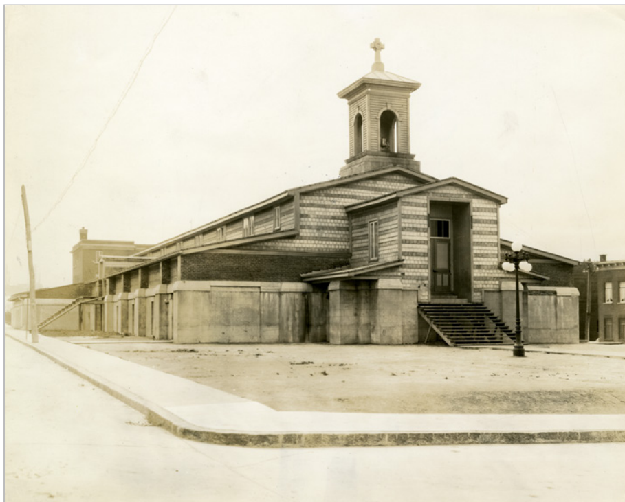
ILL. 2. ÉGLISE SAINT-JOSEPH, QUÉBEC.

[L]orsqu'elle pensait à ces choses, à cette confiance restée dans son souvenir comme une flèche empoisonnée, une vision surgissait tout à côté, une vision toute différente, où l'église, les images saintes et même les cierges allumés de ce matin où elle avait assisté à la messe avec Emmanuel, les images, les cierges, l'église s'emmêlaient. Des journées de joie pure et naïve lui revenaient à l'esprit 37 .