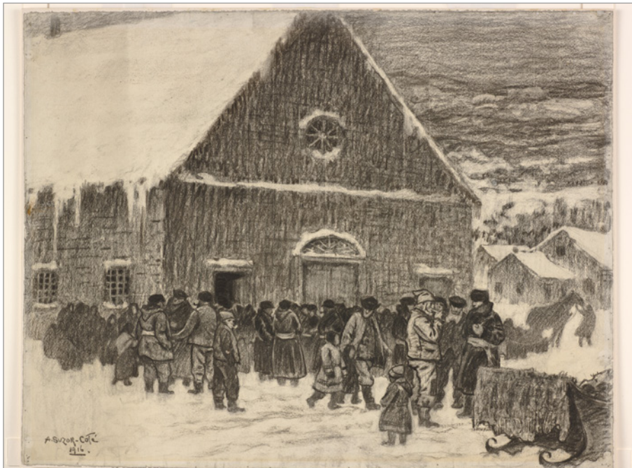
ILL. 1. MARC-AURÈLE DE FOY SUZOR CÔTÉ, ITE MISSA EST , ILLUSTRATION POUR MARIA CHAPDELAINE DE LOUIS HÉMON, 1916. | COLLECTION MNBAQ.

Il m'apparaît important d'explorer ces questions aujourd'hui puisque, dans un contexte de laïcité de plus en plus affirmée, la relation historique entre une église et sa communauté tend à être vue de manière très simplifiée, voire simpliste, ce qui est partiellement dû au fait que les historiens de l'architecture eux-mêmes – architectes ou historiens d'art de formation – se sont peu penchés sur la question. En effet, les approches privilégiées traditionnellement en histoire de