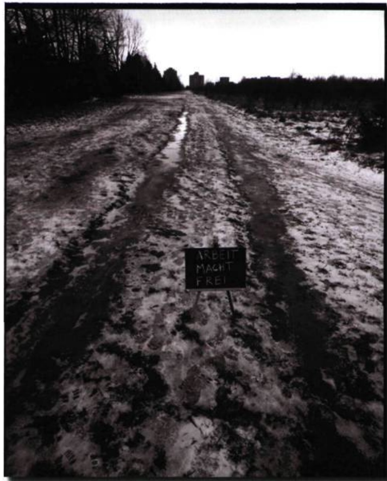
EN HAUT Little boy Environ 20 X 30 po Photo numérique, 2007