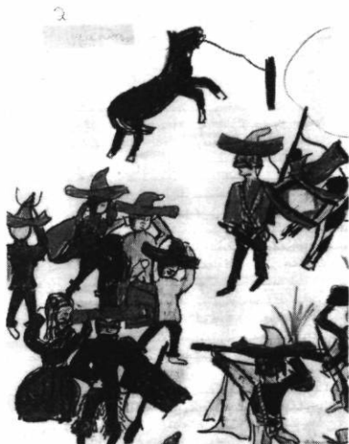
Guet-apens de bandits mexicains, crayon de couleur, 18 x 23 cm.