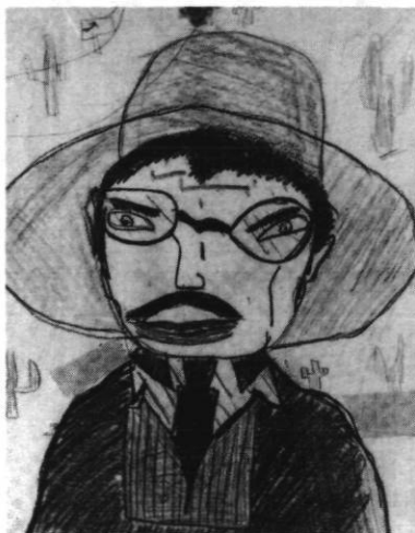
Luc l'instituteur, crayon de mine et de couleur, 18 x 23 cm.

s'oublie lui-même en faveur de l'objet, c'est vrai, mais cet objectivisme ne produit aucunement l'effet observé dans l'art académique. Tout se passe comme si cette aliénation du regard et de l'intention, dans le cas de l'enfant, loin d'asservir son art à la platitude de l'objectivité, le libérait en mettant l'enfant dans une attitude diamétralement opposée à celle du mauvais peintre en pareil cas.