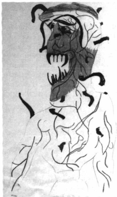
Monstre de l'espace, crayon de couleur, 21 x 35 cm.

Soleil, ou au contraire quelque chose de noir. Voici quelque chose sur le tragique. La dérision, l'amertume, la