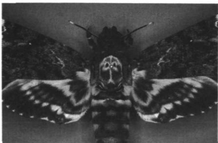
Acherontia lachesis . Guilin, Chine.

Et qu'est-ce que le Sphinx Tête de Mort pourrait laisser présager d'autre que ce que son nom suggère ?