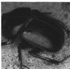
Scarabaeus Sacer . Maroc.

Par contre, des insectes au charme poétique aussi irrésistible que les papillons ont rallié un suffrage universel et suscité des associations d'images et d'idées à peu près identiques à des millénaires et à des continents de distance : symbolisations si étonnamment convergentes que nous pouvons les croire issues de l'inconscient collectif. En l'occurrence, je pense aux associations âme/papillon ou esprit/papillon qui semblent les plus universellement répandues.