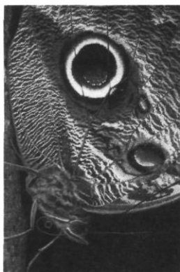
Caligo. Amazonie péruvienne.

En Amazonie, les caligos – grands papillons crépusculaires aux ailes postérieures ornées d'yeux de chouette – inspirent des sentiments inquiets aux gens qui les voient explorer la forme sombre de l'embrasement d'une porte, voire entrer dans une case et en ressortir pour en inspecter une autre ; à n'en pas douter, c'est l'âme d'un défunt qui cherche sa demeure d'autrefois, pensent-ils.