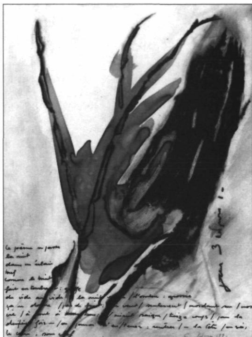
« Minuit saigne treize coups » Fusain et écoline sur géofilm 25,5 X 21,5 cm