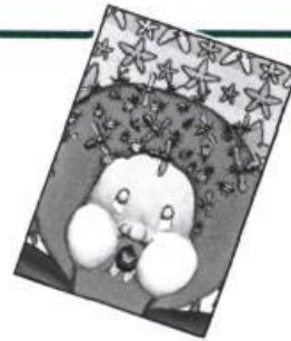
— Etoifilan, par Bertrand Gauthier, la courte échelle