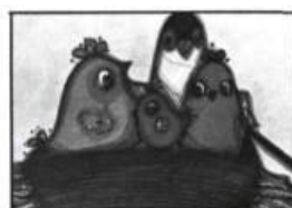
— Pitatou, par Louise Pomminville, Leméac