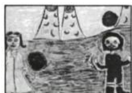
— Marlot (Marlot dans les Merveilles), par Pierre Morency, Leméac

Bref, les costumes, la musique, les accessoires colorés, l'action des personnages constituent la trame de fond qui supporte admirablement bien l'idée motrice de cet événement : stimuler le goût de la lecture.