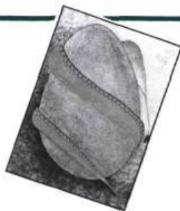
— Le Serpent Vert, par Christiane Duchesne, Héritage