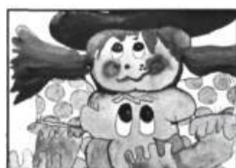
— Jiji et son ami Pichou, par Ginette Anfousse, la courte échelle