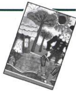
— Tourbillon, le Lutin de la Côte Nord, par Francine Loranger, Héritage