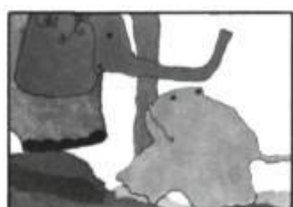
— Ouram, par Anne Valières, Leméac