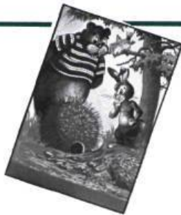
— Lapin Noir, par Jeanne Lachance, Héritage