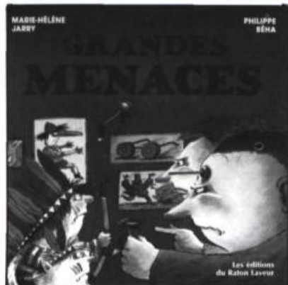
Marie-Hélène Jarry LES GRANDES MENACES Éd. Raton Laveur, 21 pages.

Ce court album évoque les « grandes menaces » ou les remontrances que les parents disent aux enfants pour se faire obéir. Qui n'a pas entendu ses parents à bout de nerfs crier : « Mange tes carottes, sinon tu vas porter des lunettes plus tard », ou autre phrase du même genre. Dans ce livre, une dizaine de phrases sont ainsi expliquées au lecteur.