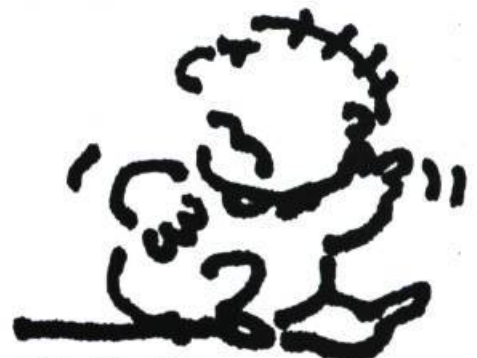
illustration : Philippe Béha