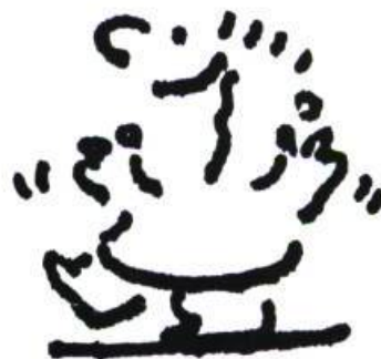
Illustration: Philippe Béha

teurs qui les publient. Enfin, je me suis intéressée aux sujets traités en tant que préoccupations de la jeunesse québécoise et à l'image du jeune qui y est présentée.