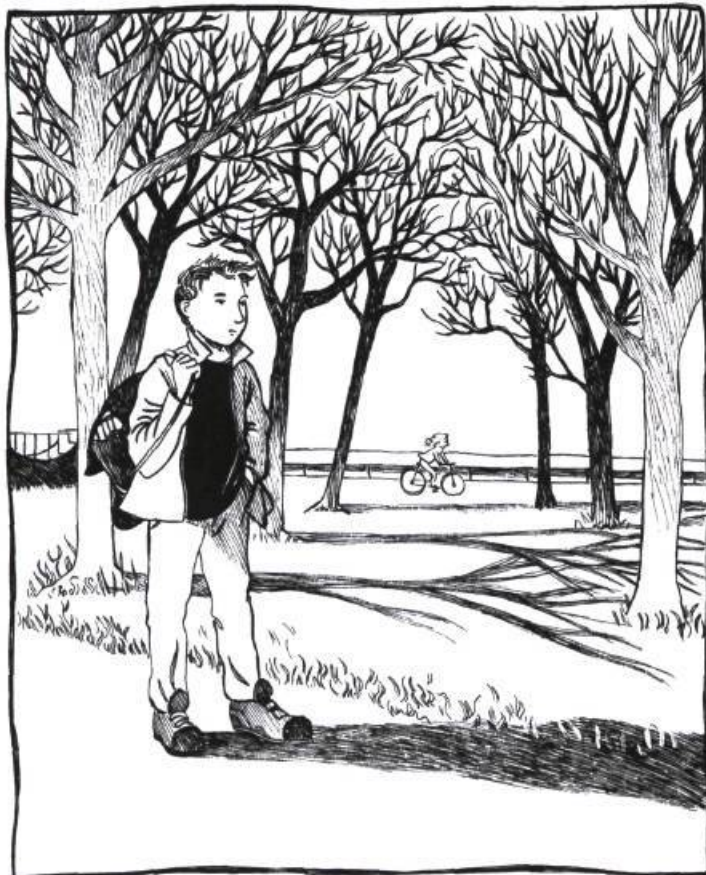
Illustration : Caroline Merola

lavant les mains pour la troisième fois, l'odeur n'avait pas semblé vouloir me quitter, comme la peine qui m'habitait. J'étais anéanti.