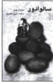
Édition iranienne de Salvador.