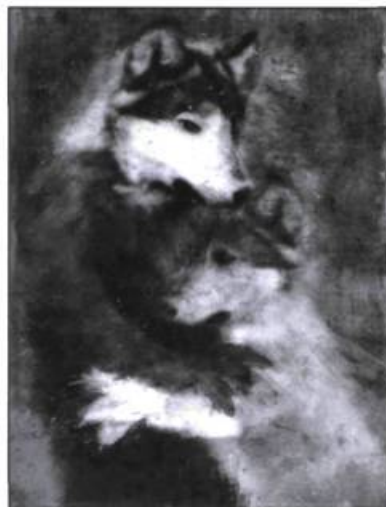
La nuit des mystères