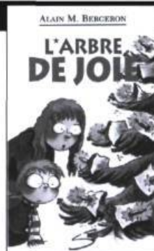
1 re édition, 1999