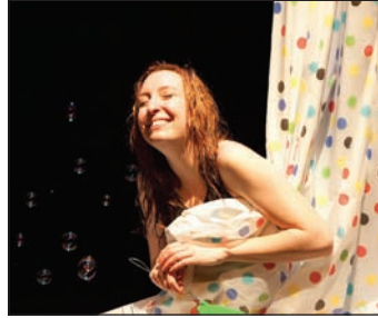
Les Zurbains 2011 : Dissection.