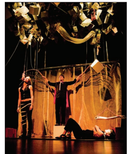
Éclats et autres libertés.