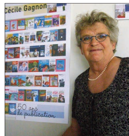
Photos couleur, prises par Daniel Sernine lors de la fête du 8 juin.