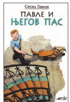
Le chien de Pavel, édition serbe.