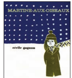
Prix de la Province de Québec, 1970.