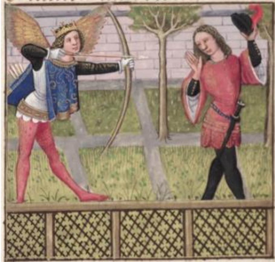
Figure 12. Amour lance sa flèche à l'Amant, MS Douce 195, folio 10v.

1693 Alors me prist une fredor Dont j'ai desouz chant peliçon Santie puis mainte friçon. Quant j'oi einssi este bersez, a terre sui tantost versez : Li cors me faut, li cors me ment, Pamez jui iqui longuement 33 .