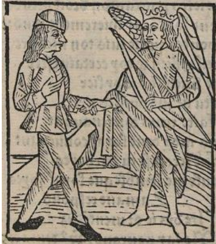
Figure 14. Amour parle à l'Amant, Rosenwald 396, folio B7r.