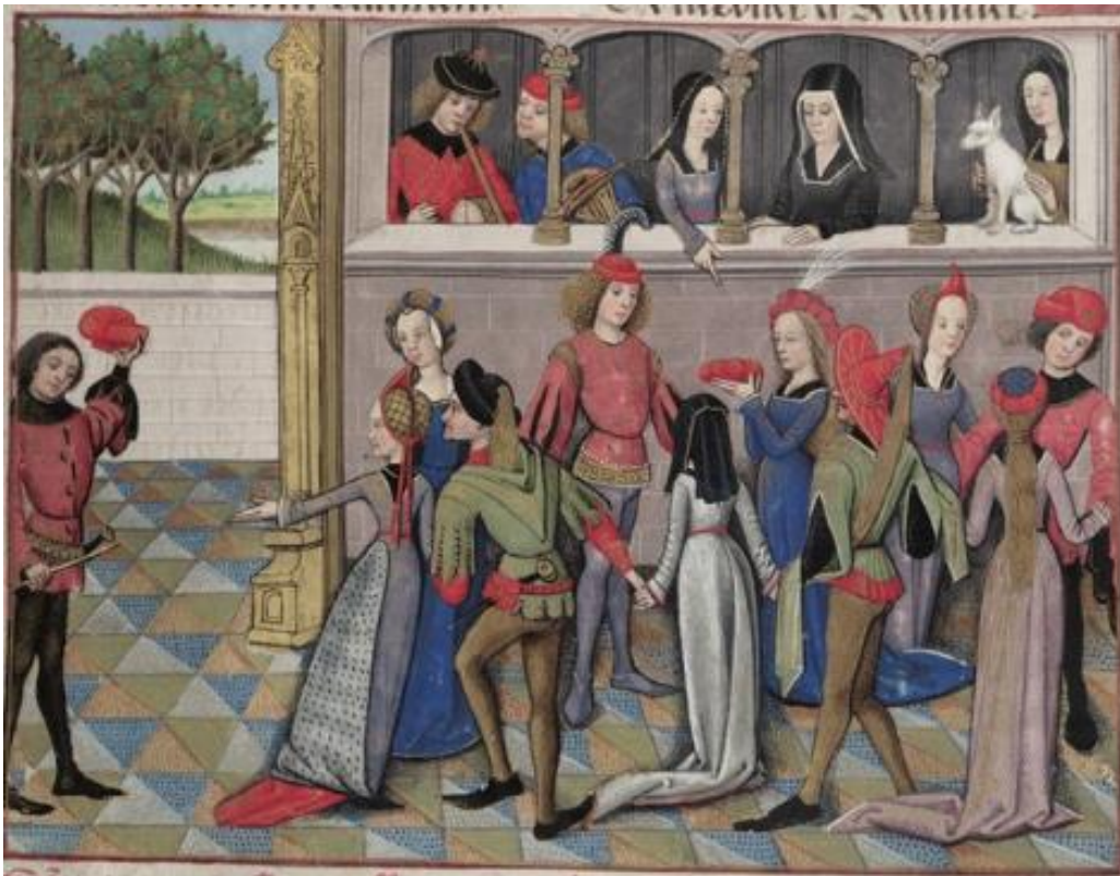
Figure 19. La carole du jardin de Déduit, MS Douce 195, folio 7r.

L'enlumineur du manuscrit Douce 195 accentue les scènes festives, par exemple en accordant à la miniature représentant la carole 36 du jardin de Déduit — événement jovial par excellence dans le texte —, quatre fois plus d'espace qu'à toutes les autres miniatures incluses dans le document. Tandis que les illustrations occupent généralement la largeur d'une colonne et une hauteur équivalente à un quart de colonne (70 x 55 mm), celle-ci prend toute la largeur de la page et plus de la moitié de l'espace consacré au texte (150 x 110 mm).