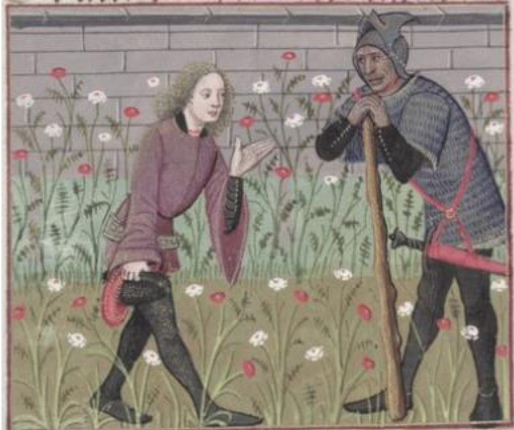
Figure 6. Amant s'excuse à Danger, MS Douce 195, folio 23v.

Il apparaît, dans l'illustration du vingt-troisième folio, que le contraste entre le personnage de Danger et les autres figures allégoriques du récit tient au changement de classe sociale. Danger n'est visiblement pas doté de la noblesse flagrante des figures qu'il côtoie. Son haubergeon (habit généralement porté par les écuyers qui, d'emblée, occupent une place subalterne par rapport au chevalier), sa posture, sa peau tannée par le soleil et la massue qu'il garde près de lui dénotent une classe sociale inférieure à celle de l'Amant qui a le teint clair (critère de beauté au Moyen Âge), les cheveux bouclés et une tunique rouge, couleur encore au XV e siècle associée à une certaine noblesse. Ce contraste entre les deux personnages est éloquent et souligne la différence de statut social qui les éloigne l'un de l'autre. Les livres médiévaux étant presque exclusivement destinés à la noblesse et la bourgeoisie, le paysan représentait une vie étrangère à la réalité de ces classes riches et incarnait ainsi une certaine forme d'inquiétude qui explique ces choix picturaux. Par ailleurs, il est essentiel d'observer que le rapport de force, dans cette enluminure, est inversé. L'Amant est nettement plus petit que Danger, il a retiré son chapeau (signe de respect et d'humilité)