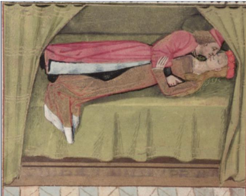
Figure 17. MS Douce 195, folio 155v.

Il joue sur le sens des mots et propose deux niveaux de lecture 35 , laissant au destinataire le choix de l'interprétation. L'enlumineur, dans sa miniature, choisit de soutenir la métaphore sexuelle en représentant les amants dans un lit, tandis que le graveur préfère estomper les propos du narrateur en exécutant une miniature où l'amant atteint finalement sa Rose.