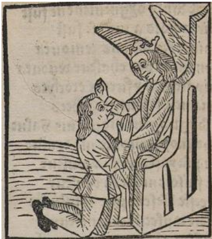
Figure 15. Amant rend hommage à Amour, Rosenwald 396, folio B7v.