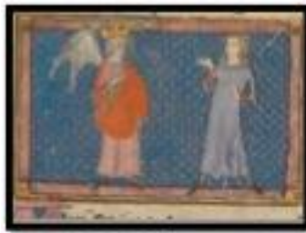
Figure 5. Amour et l'Amant, BNF fr.1569, folio 7v.

Si les premiers enlumineurs ont choisi de contourner l' ekphrasis en représentant Amour de cette manière, ceux des siècles suivants, possédant des moyens techniques plus élaborés ainsi qu'une connaissance du dessin de plus en plus complète (avec entre autres la maîtrise de la perspective) 27 , n'ont pas remis en cause l'iconographie préexistante et ont conservé les figures traditionnelles du texte 28 . Il n'est donc pas étonnant qu'il en aille de même lors du passage du manuscrit à l'imprimé.