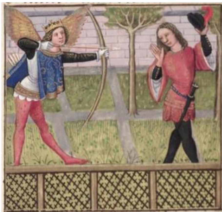
Figure 1. Amour suit l'amant dans le jardin de Déduit. MS Douce 195, folio 10v.

bouclier d'Achille, dans l'Iliade 24 ) 25 . La représentation graphique de ce type de figure soulève donc des difficultés indéniables qu'enlumineurs et graveurs du RR contournent de la même manière, soit par l'invention d'une créature autre, fictive, qui ne correspond pas à la description proposée par le narrateur. Une enluminure tirée du manuscrit Douce 195 montre que la représentation picturale de l'incarnation allégorique du dieu Amour est construite non en fonction de l' ekphrasis servant à décrire sa tenue vestimentaire, mais plutôt par rapport à la comparaison qui apparaît aux vers 899 et 900 : « Il sembloit que ce fust un anges/ Qui fust touz jors venuz dou ciau. » L'enlumineur recourt donc à la comparaison pour régler le problème de la représentation picturale du procédé rhétorique (qui est lui-même la description d'une représentation picturale).