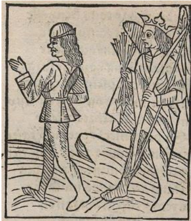
Figure 2. Amour et l'Amant. Rosenwald 396, folio B3r

divinité du personnage, mais on ne voit guère les oiseaux et les fleurs qui devraient le couvrir.