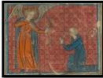
Figure 4. Amour et l'Amant, BNF fr.378, folio 18r.