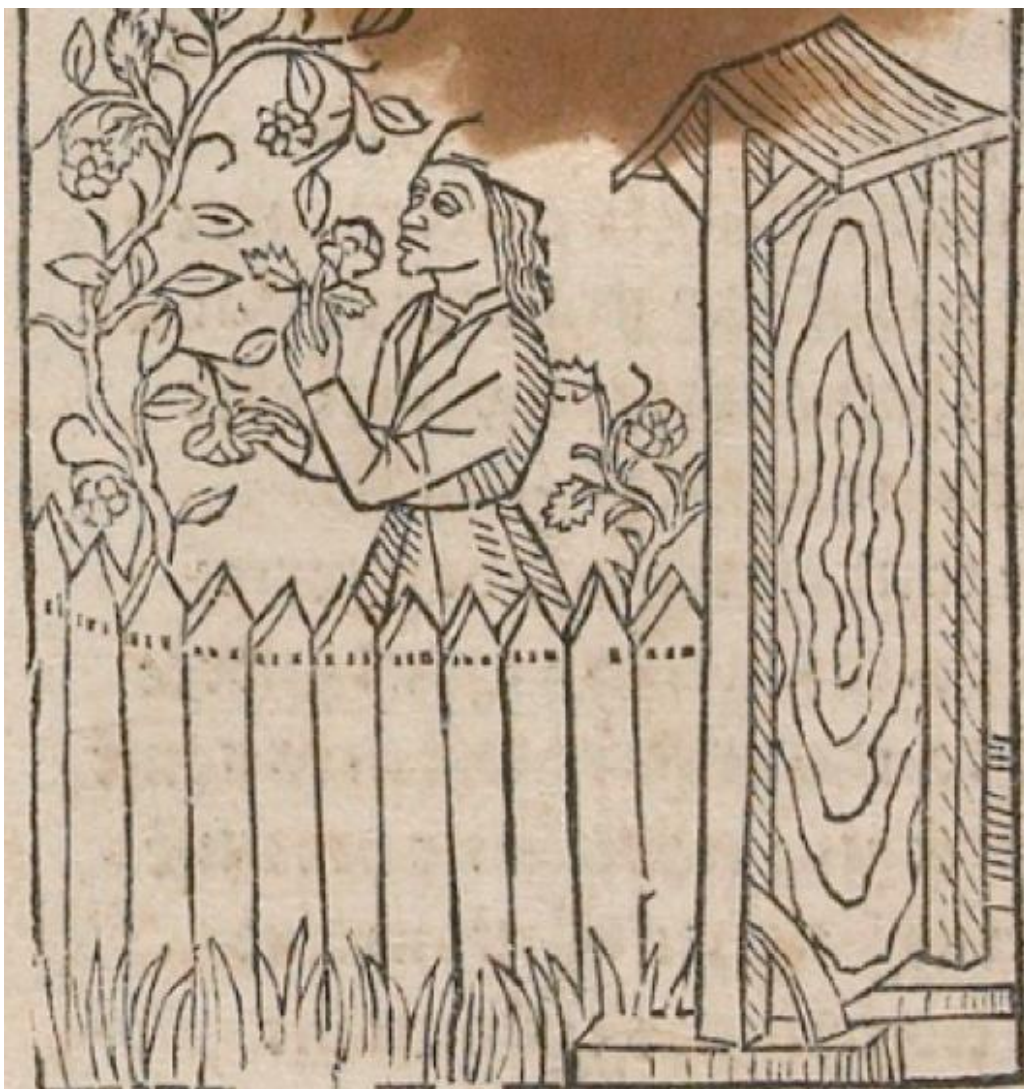
Figure 18. Rosenwald 396, folio T5v.

Un examen attentif de la gravure tend cependant à faire apparaître que le double sens n'a pas échappé à l'artiste, qui a choisi de représenter l'allégorie plutôt que de l'interpréter. Malgré la sobriété de l'image, la porte en bois représentée à droite de la gravure présente un motif équivoque qui n'est pas sans rappeler le sexe de la femme.