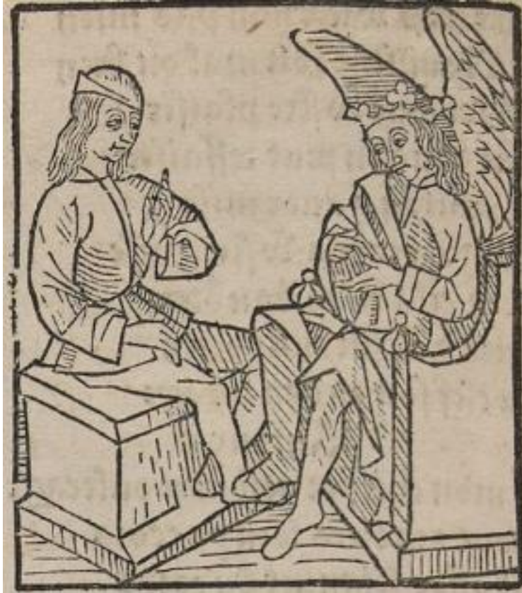
Figure 16. Amour donne ses commandements, Rosenwald 396, folio B8v.

Ce choix iconographique étonnant semble s'expliquer par la manière fondamentale d'aborder l'allégorie, visiblement divergente d'un document à l'autre. Contrairement à l'enlumineur, le graveur travaille davantage sur les deux niveaux de discours présents dans le texte, le sens littéral et le sens figuré. Il paraît se refuser au jeu de l'interprétation et cherche à rendre compte de la complexité des niveaux de sens, comme le montre de manière encore plus éloquente la miniature finale des deux documents.