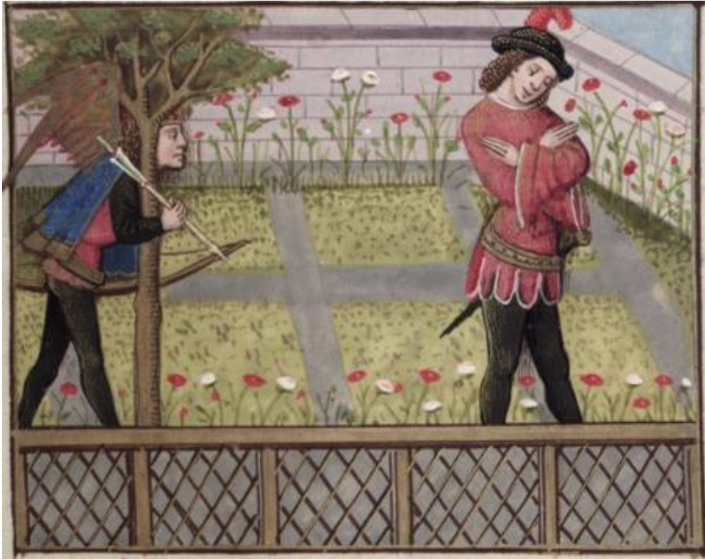
Figure 11. Amour suit l'Amant, MS Douce 195, folio 13r.

1686 Il a tantos pris une flesche; Et quant la corde fu en coche Il entesa jusqu'à l'oreille L'arc qui estoit forç a merveille Et trait a moi par tel devise Que parmi l'ueil m'a ou cuer mise La saiete par grant redor 32