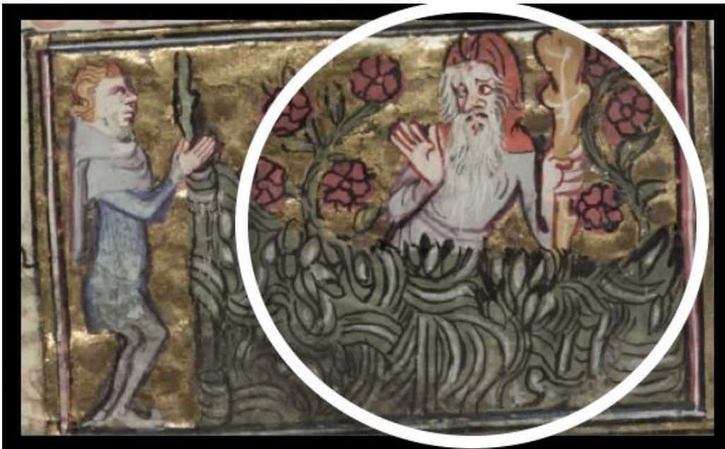
Figure 9. L'Amant s'excuse à Danger, MS Selden Supra 57, folio 22v., XIV e siècle.