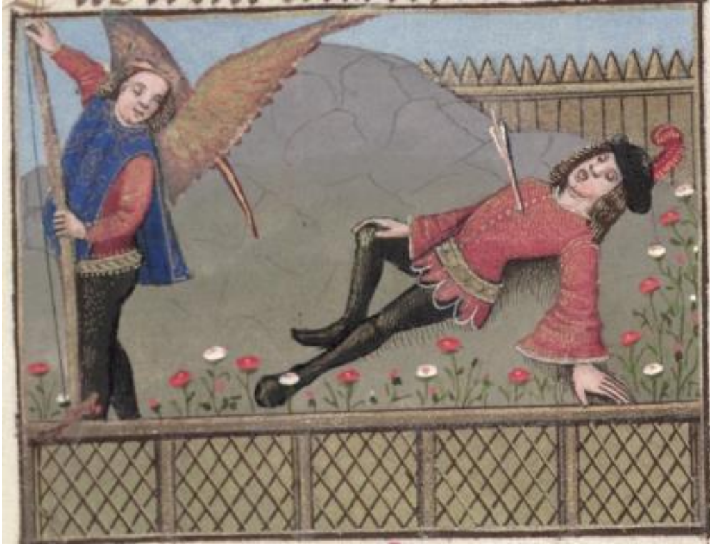
Figure 13. Amant est touché, Ms Douce 195, folio 13v.

La situation n'est pas la même dans l'incunable où l'iconographie se déploie en suivant une logique qui met en valeur la représentation vassalique qui s'instaure suite à cette scène violente, entre l'Amant et Amour.