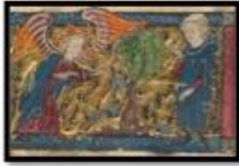
Figure 3. Amour et l'Amant, BNF fr.1559, folio 15r.