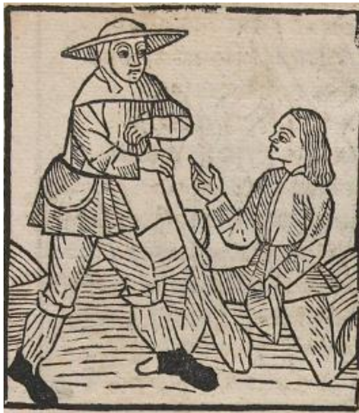
Figure 7. Amant s'excuse à Danger, Ronsenwald 396, folio c7v.

L'humilité de l'Amant devant Danger (et l'humiliation de la noblesse devant le paysan) est plus marquée encore dans l'incunable. En effet, l'Amant tient toujours son chapeau à la main, mais cette fois il ne fait pas une simple révérence, il s'agenouille plutôt devant Danger.