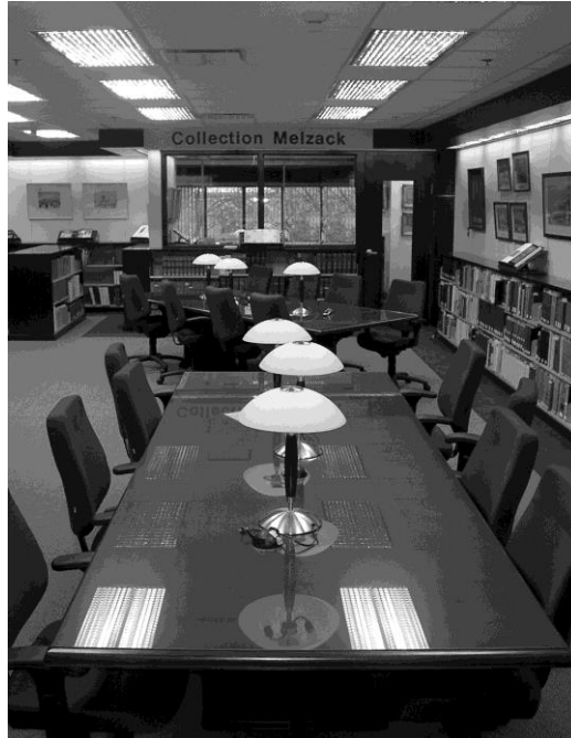
Salle de consultation principale inaugurée en 2004, BLRCS, UdeM.