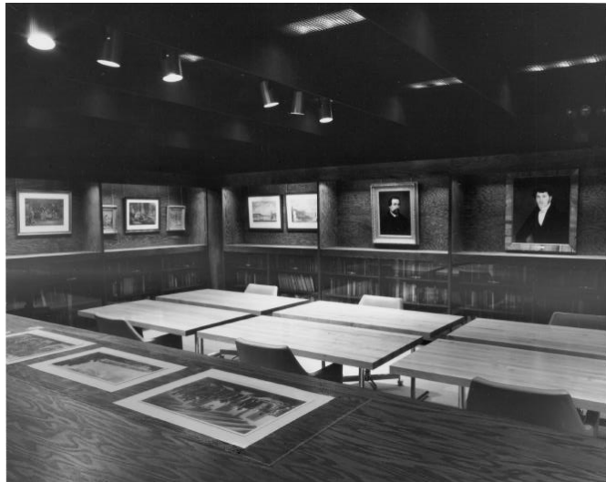
Salle Melzack, aménagée dans le pavillon Claire-McNicoll en 1973, BLRCS, UdeM.

Prévoyant et visionnaire, Melzack impose quelques conditions importantes à sa donation. L'entente prévoit ainsi l'embauche d'un bibliothécaire attitré, la construction d'une salle pouvant accommoder 10 lecteurs et l'installation d'une galerie d'exposition, le tout afin de faciliter la consultation et la diffusion des documents 31 . La salle Louis-Melzack est aménagée au début de 1972 et est ouverte au mois de juin suivant dans l'actuel pavillon Claire-McNicoll. Elle servira d'écrin à la collection, mais aussi de base d'opération au SCP.