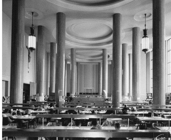
Salle de lecture de la bibliothèque centrale de l'Université de Montréal

Le 3 juin 1943, le campus de l'Université de Montréal sur la montagne est inauguré en grande pompe après de longues années d'incertitude. Raymond Tanghe (1898-1969), auteur, enseignant et bibliothécaire, est chargé d'organiser la nouvelle bibliothèque centrale de l'Université de Montréal située sous la tour du pavillon principal, aujourd'hui pavillon Roger-Gaudry. Elle n'ouvrira officiellement ses portes qu'en 1945.