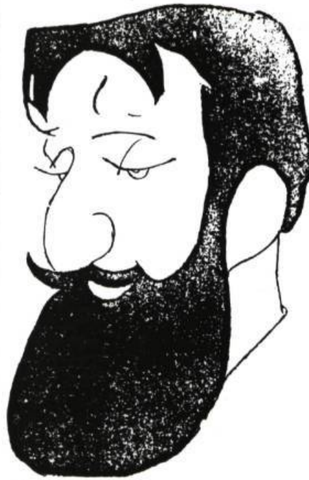
Horacio Quiroga, dans La Nación , le 15/1/1922