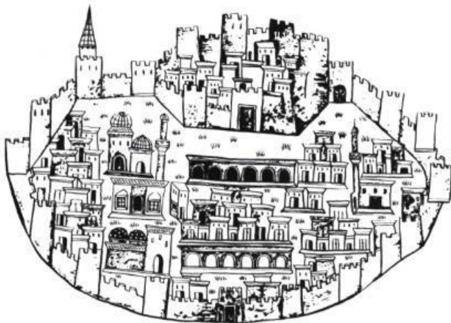
La mosquée turque dérive de l'ancienne salle de prière à dôme d'Anatolie. Dessin extrait de l'itinéraire de Násúh al-Matrakí (XVI e siècle) représentant la ville turque de Bitlis

N.B. — D'où tirez-vous vos fondements de psychologie pour vos personnages?