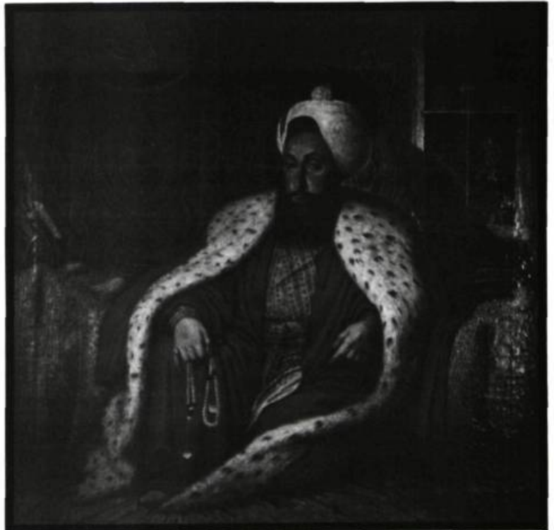
Selim III, sultan de Turquie de 1789 à 1807, a sérieusement tenté de réformer l'administration et l'armée jusqu'à son renversement et son assassinat

Y.K. — Oui, mais les courants sont liés dans la chaîne. On ne peut pas faire un nouvel anneau sans