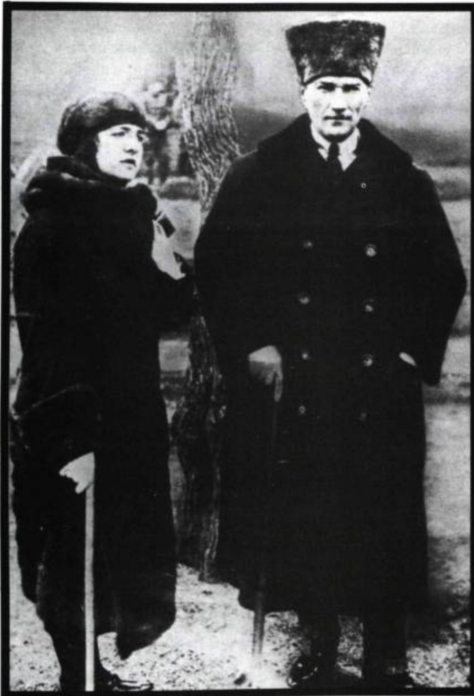
C'est en 1923 que Mustafa Kemal, que l'on voit ici avec son épouse, a instauré la République turque

humaine peut évoluer dans cet environnement, dans les métropoles comme Paris, New York, Tokyo, Istanbul, Londres. Mais ces villes sont le théâtre de suicides collectifs! Pour quelqu'un qui s'intéresse à l'être humain, il est impossible d'écrire quoi que ce soit sans penser à ces trois grands problèmes que j'ai mentionnés.