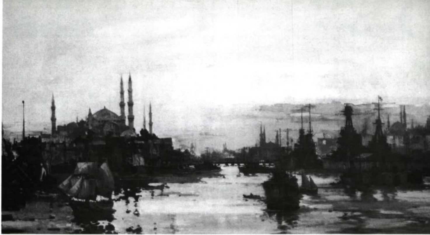
Pour la Turquie, la défaite de 1918 sonnait le glas de la dynastie ottomane. Le spectacle de la flotte alliée au mouillage dans la Corne d'Or est le symbole de la fin d'une époque

mence à publier. Ses plus grands romans, les deux Mèmed , L'herbe qui ne meurt pas (Prix du Meilleur livre étranger), Tu écraseras le serpent disent l'attrait de cette région blottie au pied des monts Taurus.