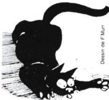
Dessin de F. Murr

Enfin, Le chat et la palette d'Elisabeth Foucart-Walter et Pierre Rosenberg (Adam Biro), une recherche iconographique et une étude sur la représentation symbolique du chat dans la peinture occidentale, comblera les amateurs d'art... et de chats. ●