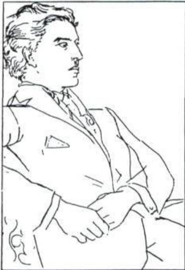
André Breton par Picasso