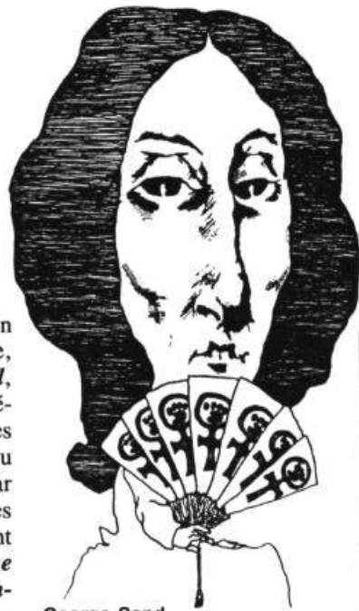
George Sand par William D. Bramhall, Jr.

Montréal éclaté : Qu'on parle du Montréal imaginaire, comme dans Lire Montréal , actes du colloque tenu au Département d'études françaises de l'Université de Montréal, ou du Montréal réel, scruté par les sociologues, politicologues et anthropologues collaborant au dernier numéro de Revue Internationale d'Action Communautaire (n° 21/61) : « Villes cosmopolites et sociétés pluriculturelles », un même constat apparaît : l'éclatement. Pas celui marqué par la Main , la célèbre division Est/Ouest, entre le monde anglais et le français , mais celui des univers vécus. Les deux ouvrages analysent les marges, le cosmopolite, le pluriculturel, l'interculturel, le mixte ; le vrai et le faux, l'envers et l'endroit de la ville et de ses quartiers. Comment à travers cela se rapaille la ville ? La réponse est laissée aux lecteurs. ●