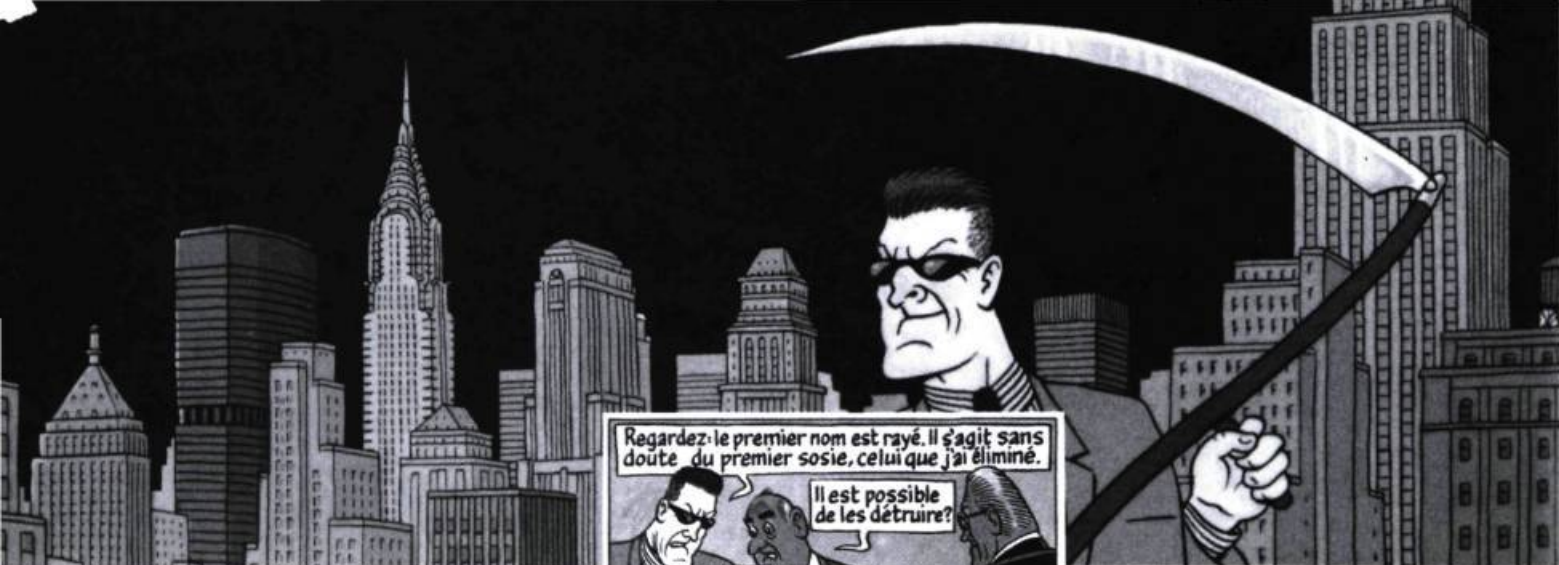
Red Ketchup contre Red Ketchup, par Réal Godbout et Pierre Fournier