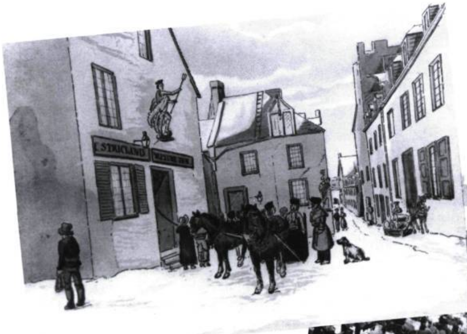
L'Hôtel Neptune à Québec, 1830, d'après un dessin du Colonel Cockburn