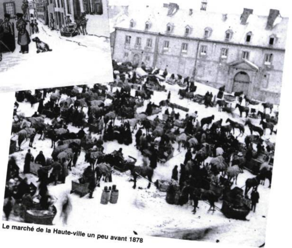
Le marché de la Haute-ville un peu avant 1878

Les habitants arrivent avec leurs traditions et leurs coutumes françaises, mais bientôt s'en démarquent : influence du climat, mais aussi des Indiens, qui ne se sont pas contentés d'enseigner aux colons comment soigner le scorbut, mais encore comment faire face au climat, comment trapper, comment faire la guerre d'embuscade, et surtout que les mœurs françaises ne sont pas le seul modèle.