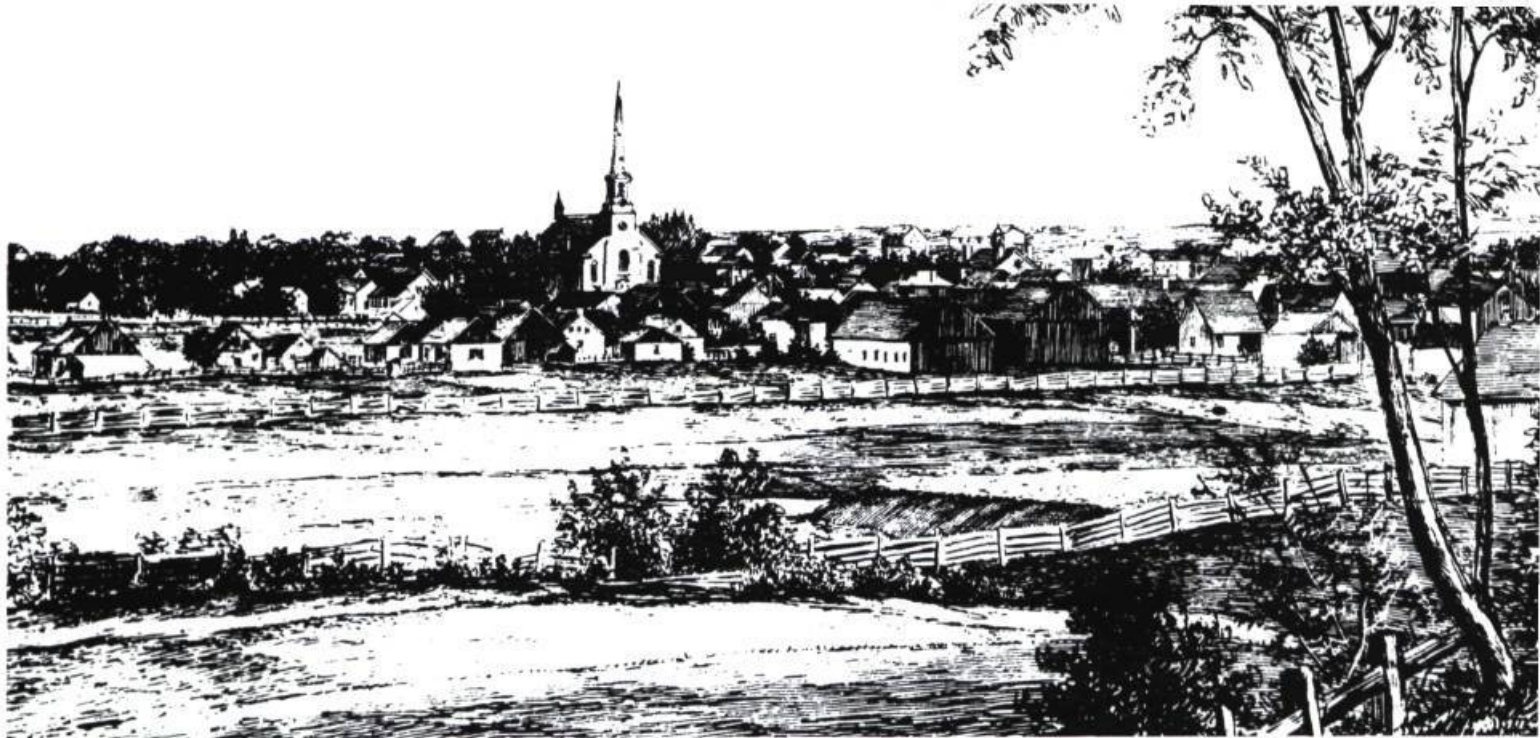
Can. ill. News