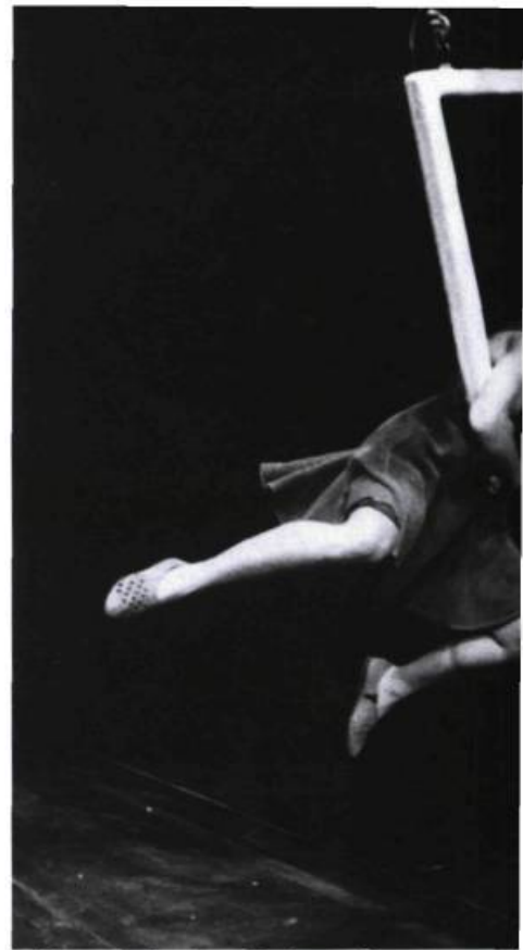
Peau, chair et os, Carbone 14

Le théâtre a toujours été d'abord et avant tout art du présent, avec tout ce que le moment comporte d'intensité, de fugacité, mais aussi de mémoire et de nouveauté en gestation. Art polymorphe et polysémique aux multiples langages, le théâtre échappe aux définitions et suscite maints malentendus. Assimilé, par exemple, au seul texte dramatique — qui n'est pourtant qu'une de ses composantes —, il a longtemps été considéré comme une branche de la littérature. Sur ce point, il est révélateur que la plupart des Histoires du théâtre ne sont que des Histoires de la dramaturgie. Comme si les créations des autres artisans du théâtre, metteurs en scène, acteurs, scénographes, n'avaient d'autre but que de servir l'œuvre du seul véritable créateur, le dramaturge, à qui l'on confère un statut privilégié dans le processus de création. La méprise s'explique du fait que le texte dramatique constitue la seule permanence, le seul matériau solide du théâtre, tandis que son autre composante, la représentation, échappe, par sa nature fuyante et éphémère, à presque toute prise en considération, ou tentative d'en retenir, d'en conserver quelque élément durable.