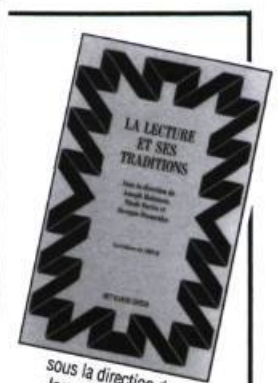
sous la direction de Joseph Melançon