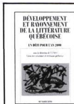
présenté par l'Union des écrivaines et écrivains québécois (UNEQ)