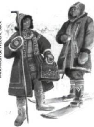
illustration de Frédéric Back

Voici des entretiens avec deux signataires du manifeste québécois le plus célèbre encore aujourd'hui : un témoignage de l'intérieur sur l'automatisme, sur toute une époque de l'histoire de l'art québécois, sur Paul-Émile Borduas, mais aussi sur le parcours artistique de Fernand Leduc, le séjour à Paris et la rencontre avec les surréalistes. Entretiens avec Fernand Leduc, suivis de Conversation avec Thérèse Renaud de Lise Gauvin, (Liber).