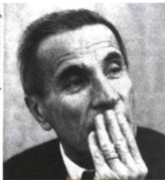
Dino Buzzati en 1965