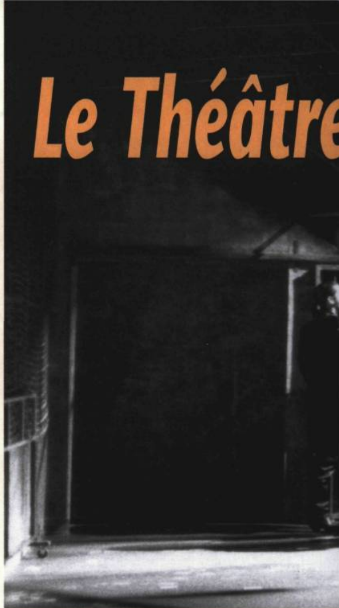
Lucky Lady de Jean Marc Dalpé, production du Théâtre Niveau Parking et du Théâtre Marie-Thérèse Fortin et Benoît Gouin.