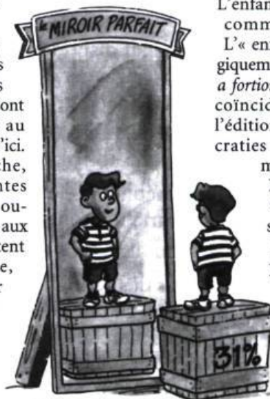
La démocratie, je la reconnais !

L'enfant n'a pas toujours été considéré comme un être doué de raison. L'« enfant » (du latin infans ), étymologiquement, est celui « qui ne parle pas » ; a fortiori , il ne lit pas non plus. Curieuse coïncidence – mais en est-ce une ? – l'édition pour la jeunesse et les démocraties occidentales sont apparues au même moment. Quand John Newbery ouvre à Londres en 1750 une Juvenile Library , la première à se consacrer uniquement à l'édition et à la diffusion de livres pour la jeunesse, il invente un concept qui est de faire de l'enfant le héros de l'histoire, de l'y associer en quelque sorte. Jules Verne a plus tard l'ambition savante de truffier ses narrations de développements pédagogiques dont le