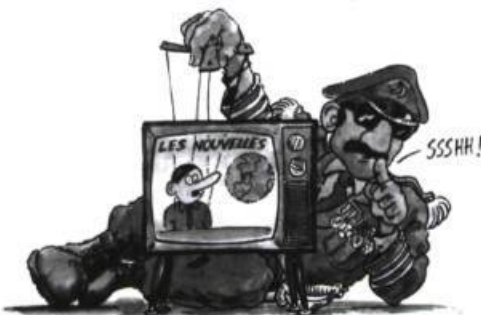
La démocratie, j'aime ça !

Laurent Laplante sait d'ailleurs, à l'occasion, placer la barre très haut. Dans La démocratie, j'aime ça ! , le jeune auditoire est mis en garde contre les « illusions de la démocratie » car il lui faudra encore savoir démêler l'apparent du vrai. Ainsi faut-il tenter de garder son