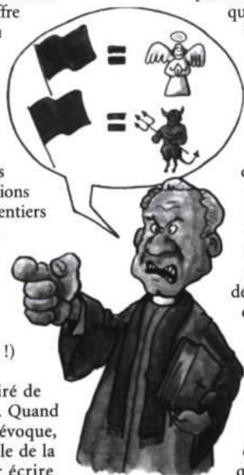
La démocratie, je l'apprends !

L'auteur parangonne, argumente, fournit notions et quintessences, avant de lâcher dans ce qu'il est convenu d'appeler une initiation ludique : « À toi de décider » ; car la liberté, explique-t-il sans faillir, peut être aussi d'expression ou d'opinion. Les albums de Laurent Laplante ne sont pas de ces dictionnaires affêtés qui renseignent et informent mais ne font rien comprendre. Au contraire, ils ont l'ambition d'organiser les savoirs et d'en tirer un sens. On ne saurait que vivement les recommander à toute la famille ; tandis que les « petits » assimileraient leurs gammes, les « grands » réviseraient profitablement leurs classiques. NS