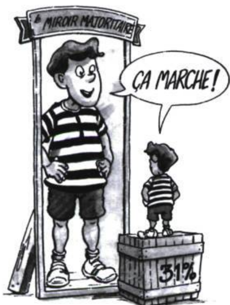
La démocratie, je la reconnais !

Dans La démocratie, je l'invente ! , il propose ainsi à ses jeunes lecteurs de faire partie du Grand Club Démocratique où ils auront les mêmes droits et la même liberté que tous les autres membres, à ceci près qu'ils auront également un devoir : celui de solidarité. Quel symbole plus marquant, pour la figurer, qu'une cordée d'alpinistes, « la fraternité à son plus beau 5 » ? Pourquoi ne pas s'inspirer du règne animal, aussi, de ce que Laurent Laplante nomme joliment « le grand