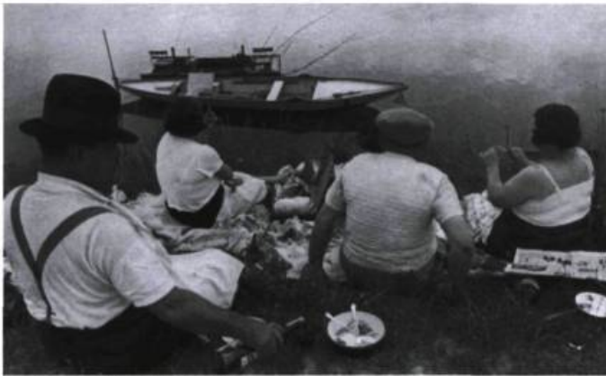
Sur les bords de la Marne, France 1938 par Henri Cartier Bresson.

Un œil irremplaçable Délaisant la caméra pour le crayon, Henri Cartier Bresson a consacré les dernières années de sa vie aux dessins. Les éditions Buchet-Chastel viennent de lancer dans la collection « Cahiers dessinés », Au crayon, qui regroupe quelques esquisses de ce grand maître de la composition photo récemment décédé.