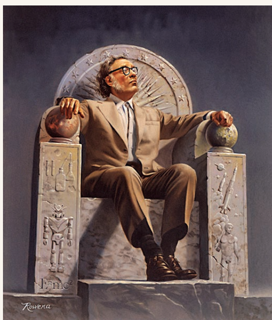
Asimov par Rowena Morrill.

Un individu qui enseigne, qui donne des conférences, sait très bien que ce type d'activité nécessite une part de spectacle. Disons de mise en scène, le besoin de ménager ses effets,