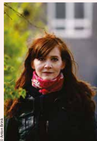
Auður Ava Ólafsdóttir

Dans Continuer (Minuit), Laurent Mauvignier nous amène jusque dans les plaines du Kirghizistan sur les traces d'une mère décidée à sauver son fils, ado rebelle dont la peur de l'avenir s'est transmuée en peur du présent. Le livre révèle les origines de cet étrange geste d'amour sacrificiel dont on suit le déroulement comme un somptueux western.