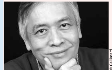
Trinh Xuan Thuan

Les albums de Tintin ne se démodent jamais, à preuve les 250 millions d'exemplaires vendus à ce jour dans le monde. Expositions, rétrospectives, études plus ou moins savantes, tout ce battage tient bien vivante l'œuvre de Hergé. S'ajoute aujourd'hui à cette liste le Dictionnaire amoureux de Tintin (Plon) d'Albert Algoud, qui s'est donné pour objectif d'intéresser ceux qui sont moins familiers avec l'œuvre, mais également les tintinophiles qu'il entend bien surprendre en débusquant des aspects moins connus du personnage.