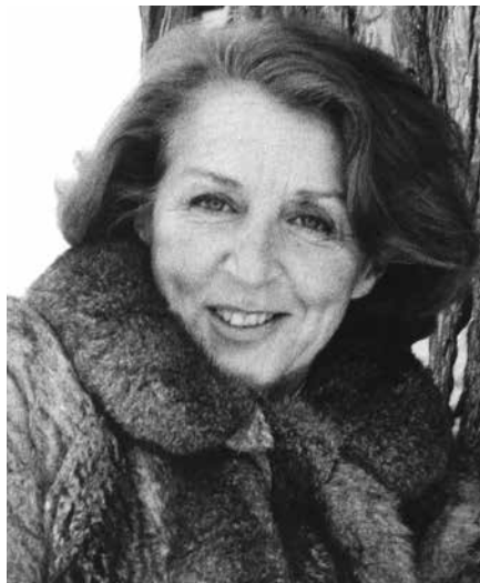
..... Madeleine Ferron à Outremont vers 1980

En imposant ainsi le silence à son frère, Madeleine Ferron mettait en péril le soutien que Jacques avait toujours apporté au travail littéraire de sa sœur. Du haut d'un droit d'aînesse pourtant limité à une seule année (Jacques naît en 1921, Madeleine en 1922), Jacques exerçait sur sa sœur une autorité sans limite : « Ton orthographe laisse à désirer : un Roméo, des Roméos, ils étaient