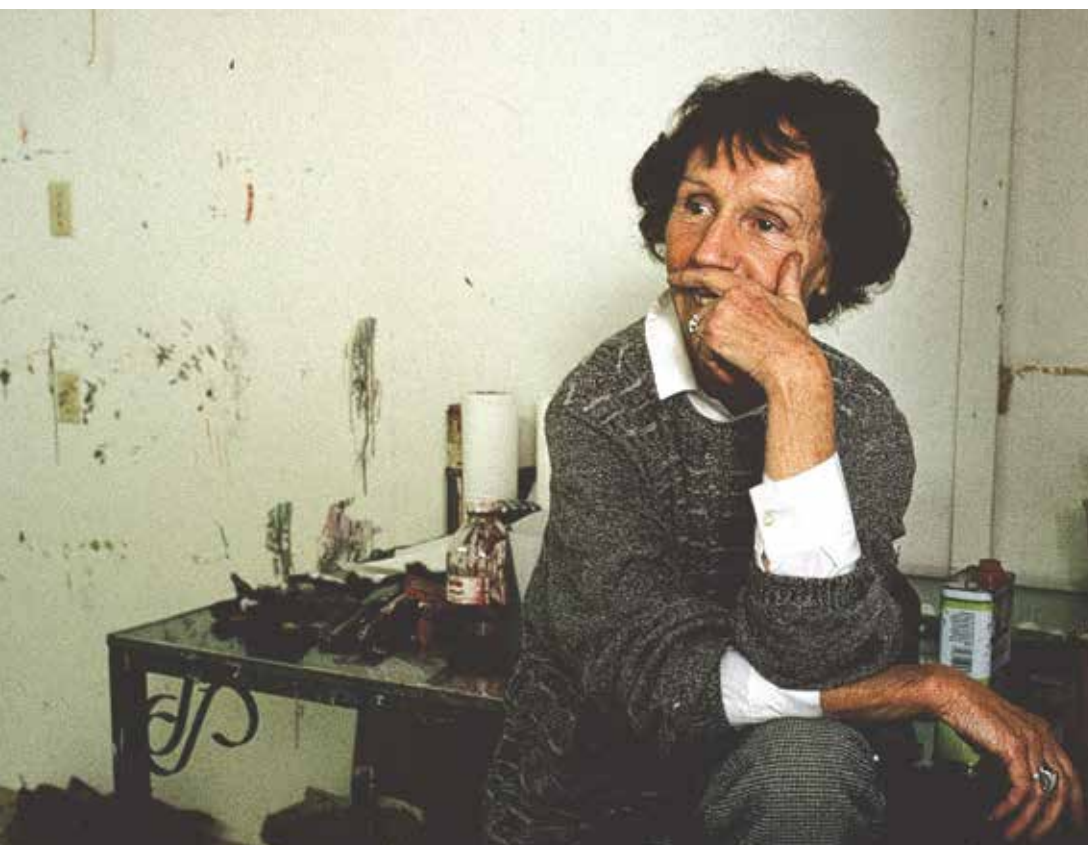
Marcelle Ferron dans son atelier d'Outremont