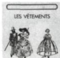
L'Histoire qui n'est pas dans les livres d'histoire