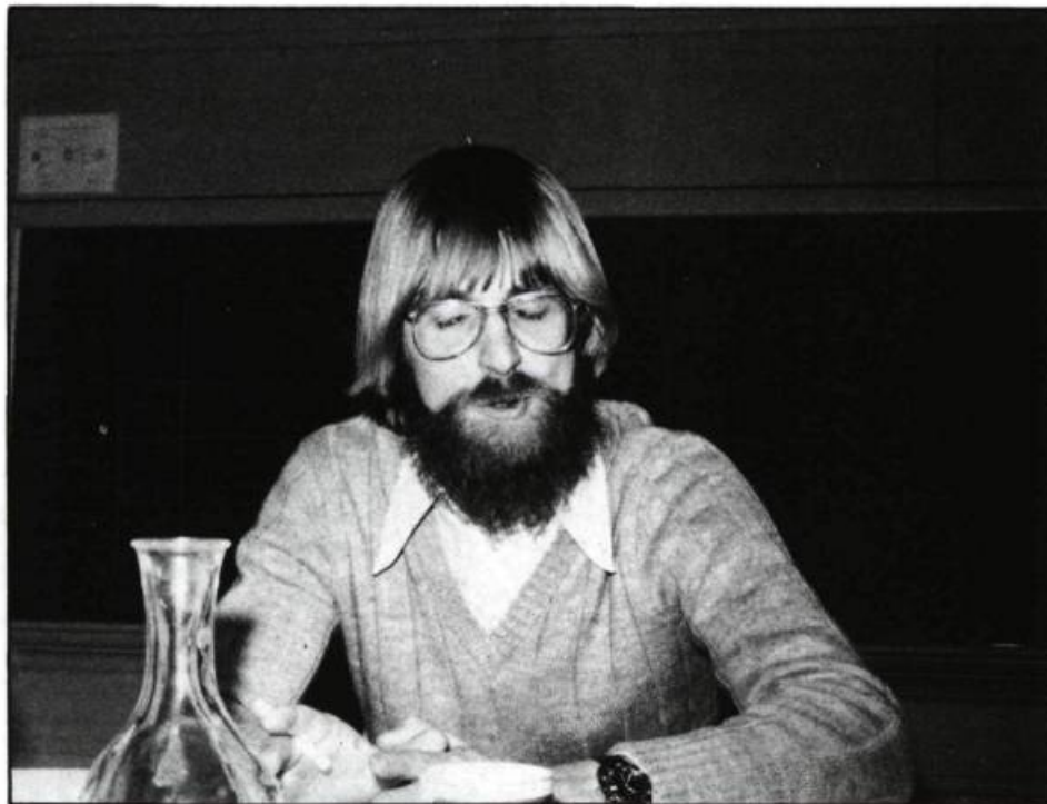
Ce n'est pas en faisant 300 millions d'exercices...

P. C.: Le programme est axé sur un modèle d'apprentissage et non sur un modèle d'éducation ou un type d'école. Le programme ne se veut pas un nouveau mouvement dans le sens que l'on a fait la synthèse des différents renouvelés pédagogiques qui étaient conciliables.