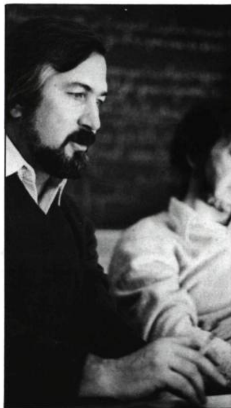
Au lieu de mettre l'accent sur les mécanismes, on le place sur les situations...

A. Vézina: L'entrée grapho-phonétique est là et est identique en 1 re et 2 e année, dans la mesure où il reste quelques problèmes d'apprentissage. La relation phonème-graphème est de l'ordre des connaissances et les connaissances sont toujours au service de l'habileté. De plus, il ne s'agit pas de présenter aux enfants tout l'éventail des correspondances phonèmes-graphèmes qui existent en français, mais uniquement les plus fréquentes et les plus utiles, et en allant du graphème vers le phonème et non pas