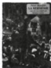
La Peinture Buissonnière