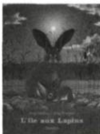
Les Albums Duculot