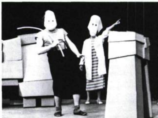
«...Une approche scénographique qui dégage d'abord et avant tout une poésie de l'espace et du mouvement...»