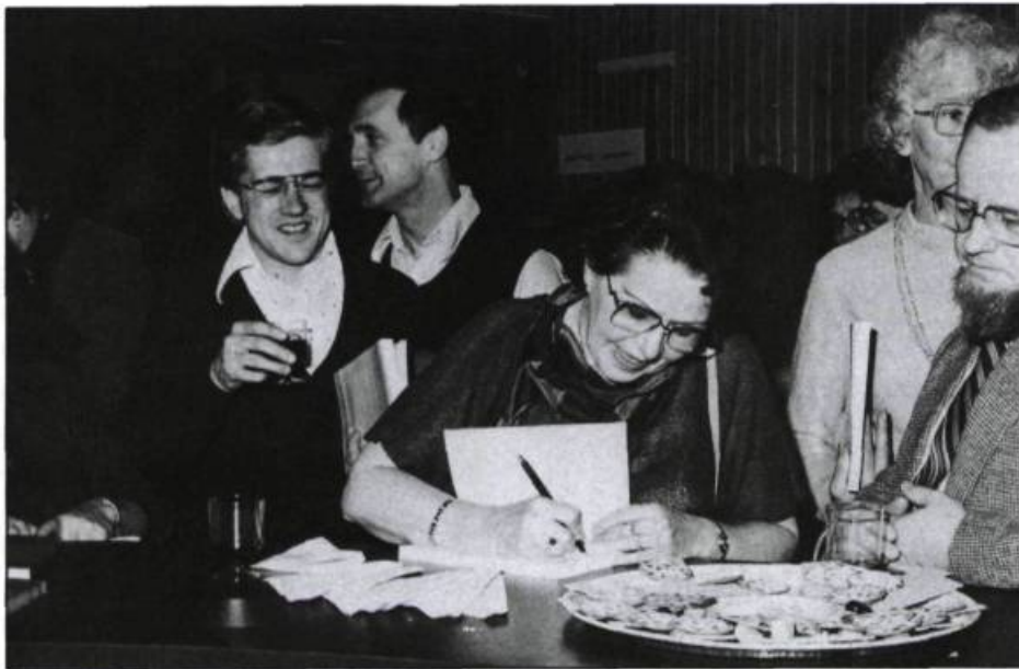
Lancement de l'ouvrage Histoire de la littérature acadienne de Marguerite Maillet, 1983, Moncton, N.-B.