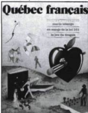
NUMÉRO 59, 1985