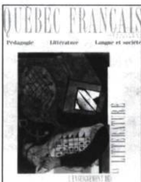
NUMÉRO 74, 1989

En cours de route, nous nous affairions à fignoler le manuscrit, dont le sous-titre révélait le sens : De l'impossibilité (presque totale) d'enseigner le français au Québec. [...] Ce manifeste forma le premier numéro d'un journal qui prit le nom d'un cri de ralliement, Québec français (il ne lui manquait que le point d'exclamation !), en novembre 1970.