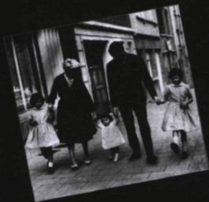
Brel, Jean-Pierre Delville, éditeur, Paris 1978.

Pourquoi faut-il que les hommes s'ennuient ? (3) Il y a (3) Les fenêtres (4) Quand maman reviendra (5) Tango funèbre (5) L'âge idiot (5) Titine (5) Le dernier repas (5) Je suis un soir d'été (6) Comment tuer l'amant de sa femme quand on a été élevé comme moi dans la tradition (6) L'éclusier (6) Jaurès (7) La ville s'endormait (7) Les F... (7) Voir un ami pleurer (7)