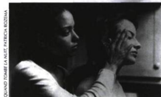
QUAND TOMBE LA NUIT, PATRICIA ROZEMA

D ans l'industrie cinématographique, la réalité lesbienne a été longtemps représentée selon un schéma homogène se conformant aux discours dominants en matière de sexualité. À l'heure où l'homosexualité est davantage acceptée, tant dans les discours que dans la société, la représentation des amours lesbiennes au cinéma tendrait alors vers de nouvelles définitions.