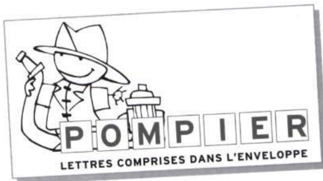
Figure 1. Exemple d'enveloppe réponse pour l'activité de consolidation lors des orthographes approchées.