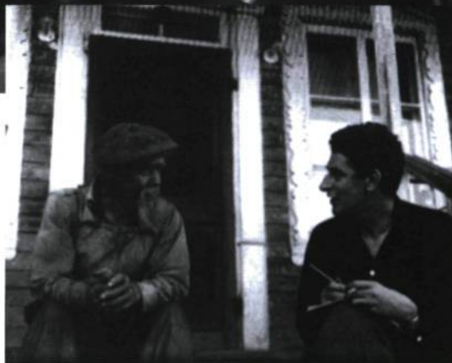
Luc Lacourcière en enquête dans Charlevoix en 1950.

Logée dans le Vieux-Québec, cette chaire avait pour but de créer un centre de documentation rassemblant des sources imprimées et manuscrites canadiennes et françaises, de mener des enquêtes à travers tout le Québec, de procéder à la conservation, à la classification méthodique et au traitement des documents recueillis, de former des étudiants et des chercheurs à l'étude scientifique des traditions populaires pour poursuivre les recherches en ce domaine, ainsi que de vulgariser et de faire connaître par des publications ces trésors de notre patrimoine. La petite équipe démontre rapidement qu'avec peu de moyens, il est quand même possible de réaliser de grands projets. C'est ainsi que Lacourcière et ses collègues, Félix-Antoine Savard, Conrad Laforte et Madeleine Doyon-Ferland, commencent à rattiser le Québec et l'Acadie en quête d'informateurs qui se révèlent détenteurs d'un savoir au potentiel extraordinaire à exploiter.