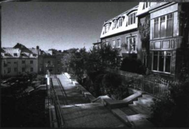
Rue du Vieux-Québec.