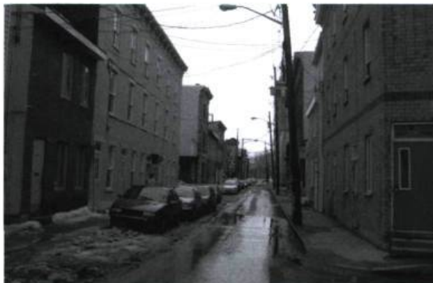
Rue du quartier Saint-Roch, basse-ville.

Même ceux qui visitent Québec pour la première fois le sentent : deux mondes coexistent à Québec, se confrontent, se regardent. Deux mondes qui s'interpénètrent mais qui, curieusement, ne se mêlent pas réellement. Si je voulais faire simple, je dirais qu'il y a en haut celui des bien nantis et des bien portants et celui, en bas, des pauvres et des écorchés. Mais c'est dans les faits un peu plus compliqué. On parle de territoires, de frontières physiques et psychologiques au-delà desquelles on n'aime pas trop s'aventurer. Ceux d'en haut descendent rarement... et ceux d'en bas ne savent pas trop s'ils ont réellement le droit de monter. Ils sont comme transis par une peur indicible, inavouable, vis-à-vis de ce qu'ils