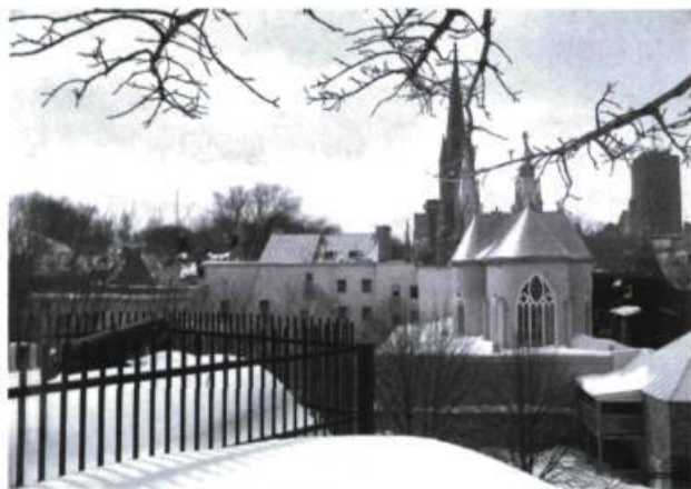
Vue du parc du Cavalier-du-Moulin

Je n'ai rien dit non plus de l'in vraisemblable quartier du Cap-Blanc, coincé entre le boulevard Champlain et le cap – encore et toujours – sur lequel des maisons sont à moitié jouguées, contre toute logique. Ce quartier, qui survient alors qu'on ne s'y attend plus, après de longues minutes à sillonner des installations portuaires aussi laides que pratiques, et dont on ne verra qu'une courte ligne de maisons si l'on n'y prend garde, recèle des trésors d'architecture et ensorcelle, très certainement, par ses rues en ruban qui se cachent les unes les autres. C'est là un quartier-