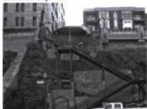
Escalier du Faubourg.

J'aime particulièrement Saint-Sauveur, une sorte d'enclave où le temps semble s'être arrêté et où les enfants jouent encore au hockey dans les rues ou montent à deux sur leurs vélos à siège banane, tout droit sortis des années soixante-dix. Saint-Sauveur, c'est le charme des boucheries et des épiceries familiales, celui du Royaume de la tarte (qui a pignon sur la rue des Oblats depuis cinquante ans) et des vieilles quincailleries. Se promener dans Saint-Sauveur vers 17 h, c'est suivre l'odeur fumante des steaks cuits dans la poêlonne (comme on dit à Québec) avec du beurre ; c'est sentir, tout d'un coup, une sorte d'unisson. C'est respirer un peu d'âme canadienne-française. Marcher Saint-Sauveur me fait du bien.