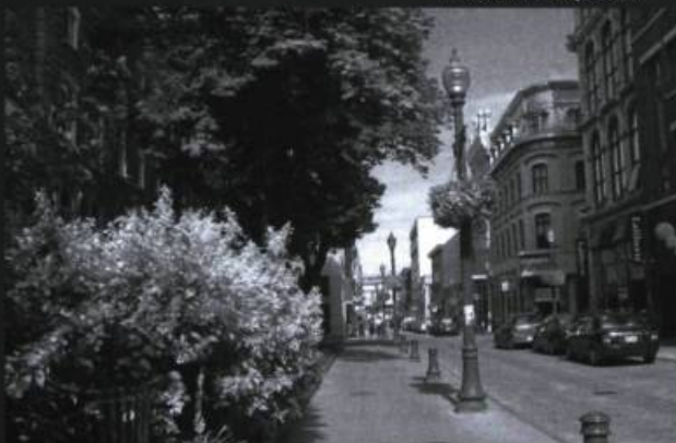
Rue Saint-Joseph, basse-ville.

La route sinueuse et large du fleuve, la ligne bleue des Laurentides, la plaine des banlieues environnantes, les Plaines des batailles perdantes : ce sont là quelques-unes des images d'Épinal qui semblent définir Québec aux yeux de plusieurs. Québec est ainsi souvent décrite comme une ville d'horizons ouverts, sur l'Île d'Orléans, le Cap Tourmente et toutes les terres de la côte sud : Lévis, Saint-Romuald, Saint-Nicolas... Mais moi, je dis que Québec, c'est du haut en bas. C'est une ville résolument verticale .