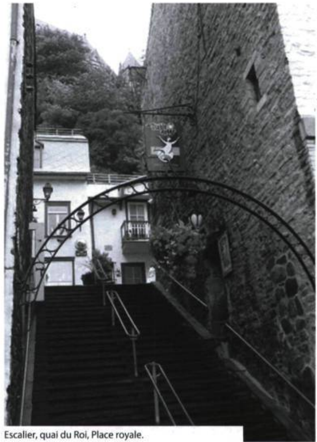
Escalier, quai du Roi, Place royale.

En bas, il en va autrement. La vie s'y déroule comme dans une enclave, où les édifices enferment le regard et empêchent de voir loin, où il n'y a de perspective que lorsqu'on regarde vers le ciel ou lorsque l'œil s'agrippe aux rochers du Cap Diamant. En basse-ville, ce sont les édifices qui décorent les rues, poussant dans le béton et l'asphalte. Parfois, dans Saint-Roch, Saint-Malo ou Saint-Sauveur, des arbres entêtés s'élèvent et viennent jeter un peu d'ombre sur les briques et les bouts de trottoir. La basse-ville a le charme beige et gris du béton et de l'asphalte et celui, aussi, sang-de-bœuf, des immeubles en brique qui ponctuent les promenades. La basse-ville grouille et vit, le bruit se répercute sur les façades. Par temps chaud, on croise, vêtus de leur justaucorps presque propre, des hommes sans âge qui squattent un carré de trottoir avec leur chaise pliante et leur bière à la main, question de venir quérir un peu d'air (devenu rare dans leur logement) et, pourquoi pas, un rayon de soleil qui oserait filtrer entre les toitures des hauts édifices. Ils sont plusieurs à se voisiner, tantôt ils blaguent, tantôt