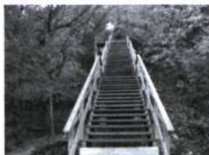
Escalier des Franciscains.