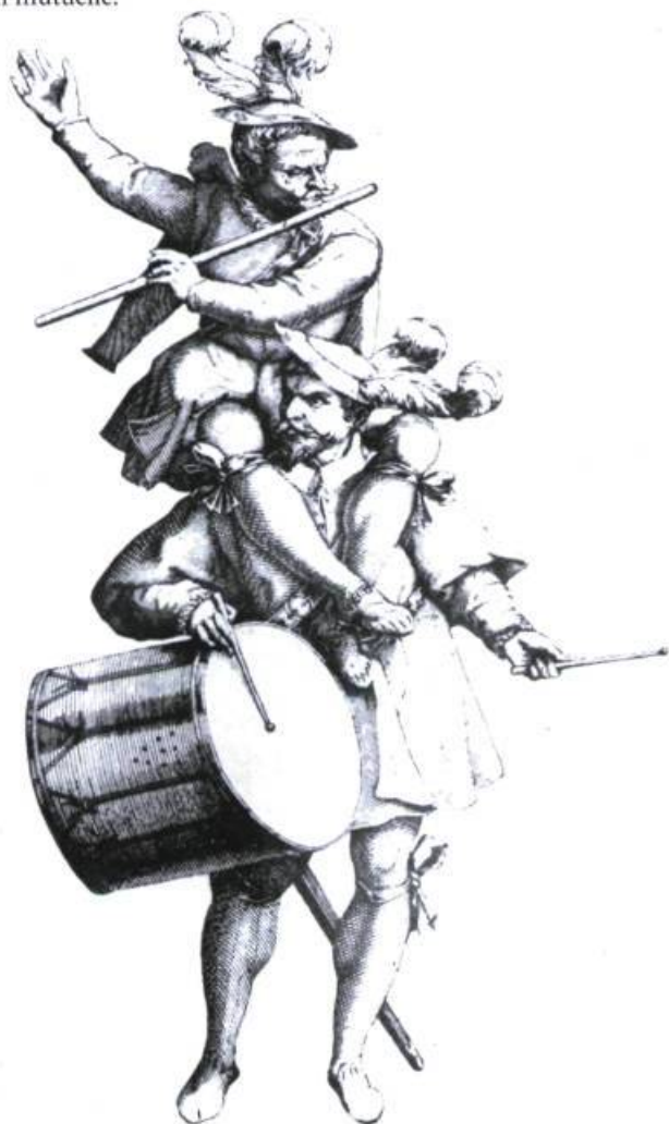
Joueurs de fifre et de tambour (Fonds public, Kerth, Munich).

Comme l'ont montré différentes études comparatistes musico-littéraires 1 , les rapports entre l'art des sons et l'art des mots semblent travaillés par une forme de tension interne, à mi-chemin entre distance infranchissable et volonté d'imitation. C'est de cette relation paradoxale, de l'espèce de concours – dans les deux sens du terme – qui existe entre la musique et la littérature, que nous voudrions rendre compte dans le cadre de cet article. Nous prendrons appui, dans cette perspective, sur les acquis de la recherche comparatiste qui invite à prendre en considération, tour à tour, l'hétérogénéité des deux langages que sont la musique et la langue (dans son utilisation commune et dans son usage littéraire) et leur imitation mutuelle.