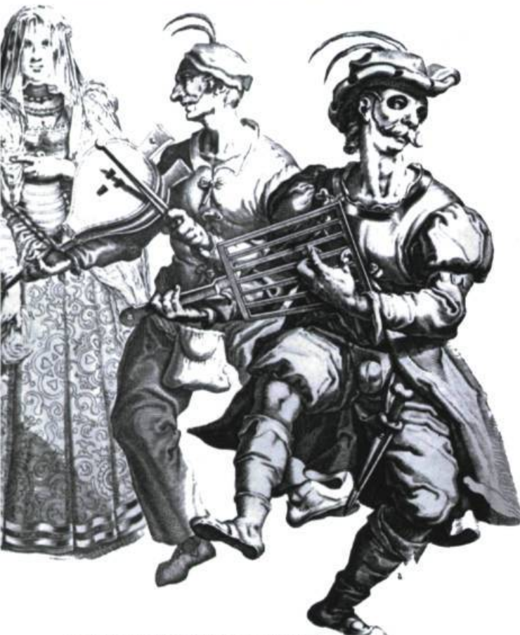
Burin de J. de Gheyn, XVII e siècle (Bibliothèque Nationale, Paris).

Réciproquement, il semble que les écrivains envient à la musique sa liberté à l'égard de la signification. Aussi la musique apparaît-elle comme un « imaginaire de la littérature 10 » et un modèle à imiter. La revendication par la littérature d'une musicalité qui n'appartienne qu'à elle s'est manifestée de manière particulièrement sensible chez Stéphane Mallarmé 11 , pour qui la mission primordiale du poète est de « rémunérer le défaut des langues », d'exhumer, pour ainsi dire, ce qui fait la musicalité propre du langage articulé 12 . Bien plus généralement, la poésie se pose en concurrente de la musique par l'usage des deux principaux procédés de la répétition et du nombre, si l'on songe au retour de sonorités identiques, notamment à la rime, et à l'usage codifié de la métrique 13 . Ces deux procédés concourent à produire un même résultat en ce que la rime, les assonances, les allitérations aussi bien que le décompte des syllabes, les césures et autres syncopes ont pour fonction de conférer au poème un rythme spécifique, et participent ainsi de sa musicalité. L'aspiration à prouver que le verbe possède sa musique confine quant à elle à des expérimentations telles que la poésie phonique 14 et sous-tend plus généralement toute entreprise poétique visant à oblitérer partiellement, voire totalement, la fonction référentielle du langage au profit d'une pure « musication 15 ».