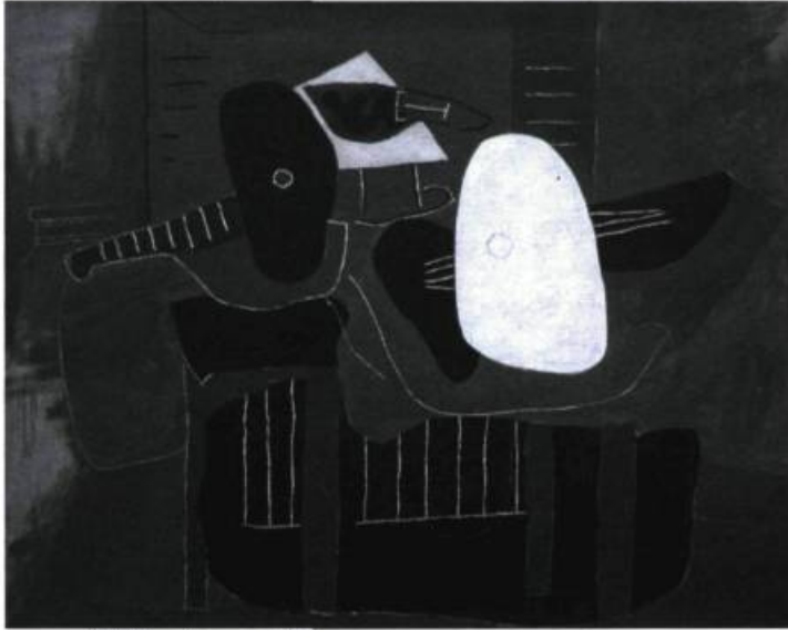
Pablo Picasso, Nature morte , 1926.

S'il existe de nombreux exemples de recours conjoint aux sons et aux mots, comme peut par exemple l'illustrer, dans le domaine de la poésie chantée, la collaboration entre Francis Poulenc et des poètes tels que Paul Éluard, Guillaume Apollinaire ou Max Jacob, il est d'autres formes d'interaction de la