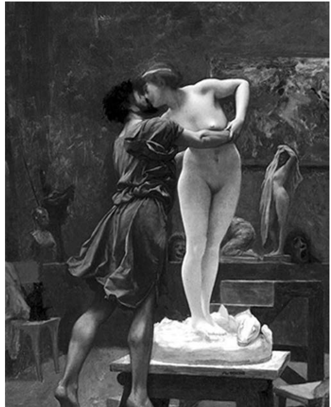
Le baiser, Pygmalion et Galatée d'après J. L. Gerome, 1890.

Mais comment se rendre jusqu'aux mythèmes, quand on n'a pas l'habitude de les identifier et quand on amorce tout juste l'exploration de l'univers infini des mythes ? Être attentif aux infimes détails qui paraissent d'emblée singuliers ou qui touchent au merveilleux dans les trois sous-catégories d'éléments mentionnées ci-dessus (événements et situations ; lieux, objets, décors ; personnages) constitue un bon point de départ. Par exemple, lorsque l'élève remarque une « pomme d'or », dans le conte « Le diable aux trois cheveux d'or » (Grimm, Contes choisis , 2000), par exemple, on peut l'inviter à commencer ses recherches dans un dictionnaire ou une encyclopédie des symboles ou, si on souhaite intégrer les TIC et qu'on dispose d'un laboratoire informatique, dans Internet. Il apprendra alors qu'un tel fruit évoque