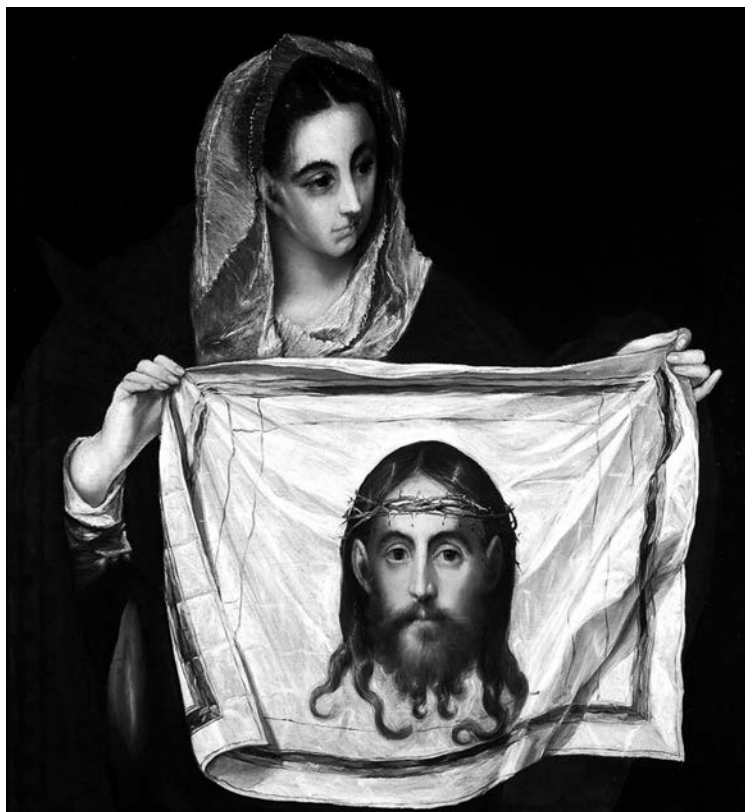
El Greco, Sainte Véronique avec le suaire , 1579 (Musée de Santa Cruz, Tolède).

« Véronique expliquait qu'après une série d'expériences de photographie directe sur papier, elle était passée à un support plus souple et plus riche, la toile de lin. Le tissu, rendu photosensible par une imprégnation de bromure d'argent, était exposé à la lumière. On y enveloppait ensuite le modèle, sortant tout trempé encore d'un bain de révélateur, des pieds à la tête, comme un cadavre dans un linceul, précisait Véronique. La toile était enfin traitée au fixateur et lavée. Des effets intéressants de mordancage pouvaient s'obtenir à condition de badigeonner le modèle au bioxyde de titane ou au nitrate d'urane. L'empreinte prenait alors des dégradés bleutés ou dorés. En somme, avait conclu Véronique, la photographie traditionnelle se trouve dépassée par ces créations nouvelles. » (Tournier, « Les suaires de Véronique », Le coq de bruyère , 1978, p. 170-171)